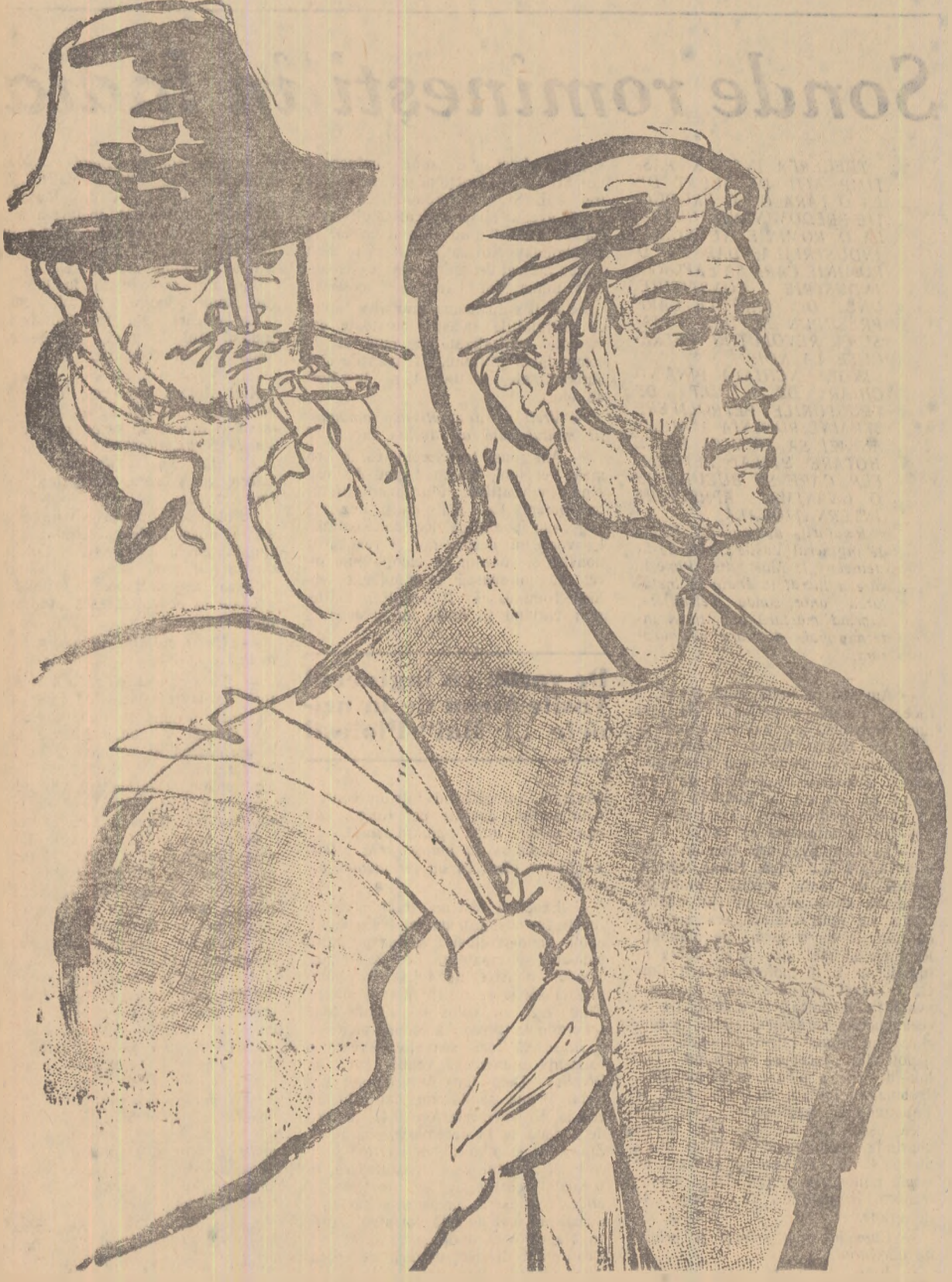
Desen de GRIGORE ONUT