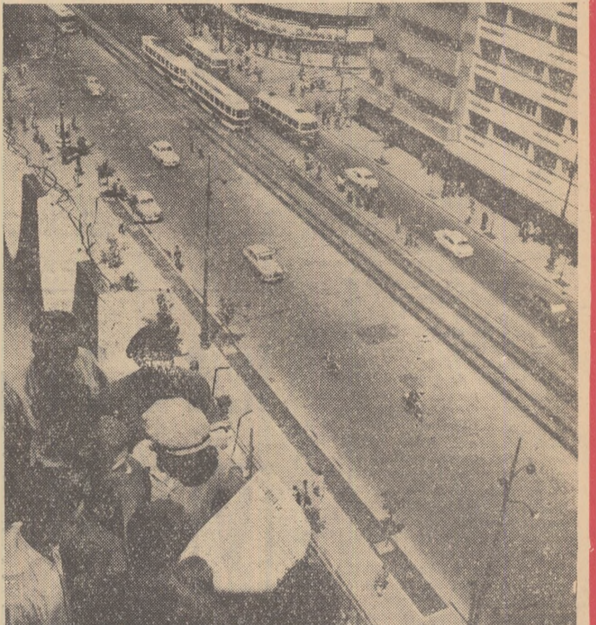
La etajul 9 al unui bloc în construcție, pe Bd. N. Bîlcescu, muncitorii citesc proiectul Directivelor Congresului al III-lea al P.M.R.

Intruic privește agricultura perioada planului prevede încheierea procesului de colectivizare cu tot ceea ce el atrage ca metodă înaintată de cultivare și neîncoțată folosire de unelte tot mai perfecționate. Nici una din ramurile producției agricole nu este uitată. Plante, legume, pomicultură și viticultură toate sînt prevăzute într-un randament sporit. Bogăția țării, bogăția vîltoare, din ce în ce crescută o poți privi pe planul pînă în 1965 cu pe o hără cu un relief crescut. De cifrele acestea amănunțite sînt legate și frumusețile privești și ale muncii felurite care de pretutindeni vor veni să dea o mai mare bucurie de viață unui întreg popor muncitor și iubitor de liniștea și pace. În primul rînd așezarea în așa-i vieții va fi ajutată cu un spor