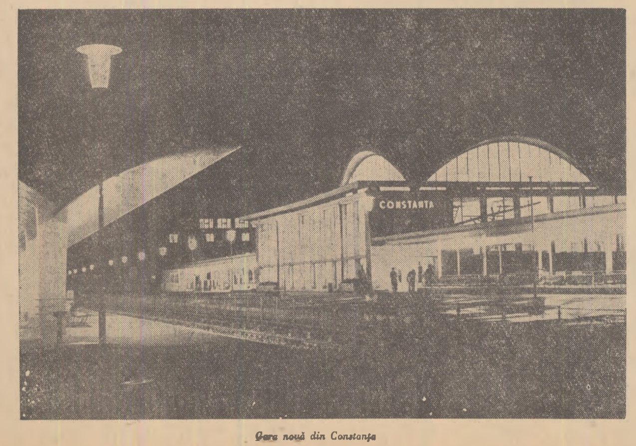
Qare nouă din Constanța