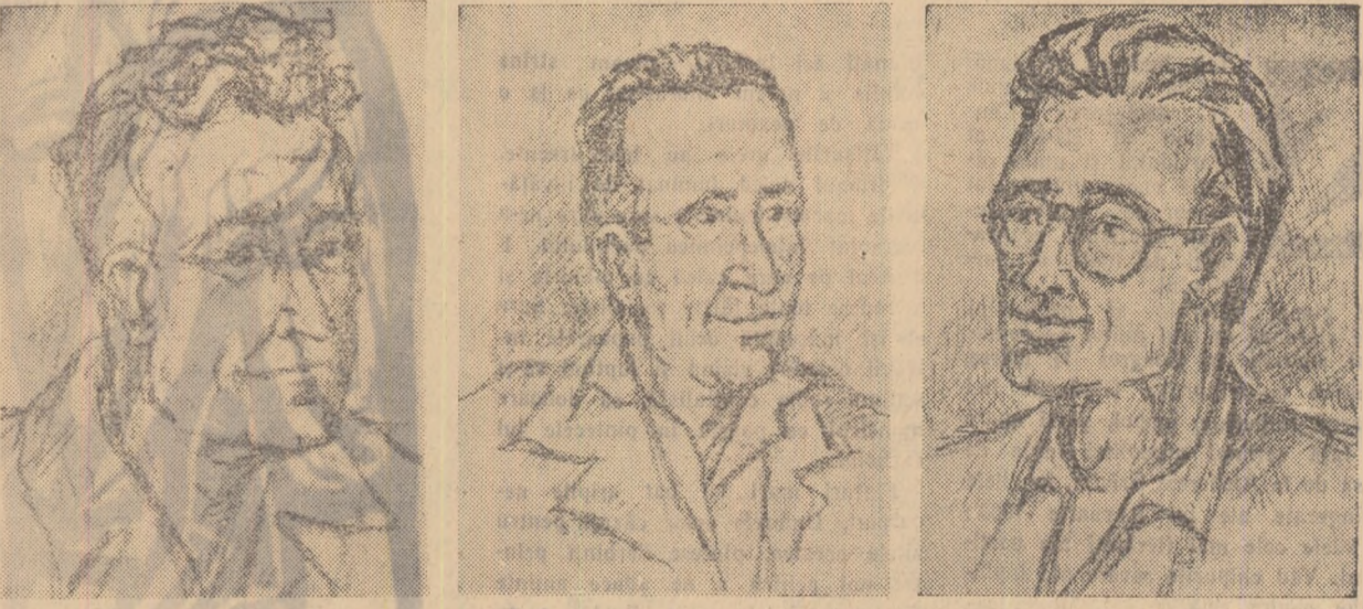
Muncitori fruntași la uzinele „Mao Tze-dun”