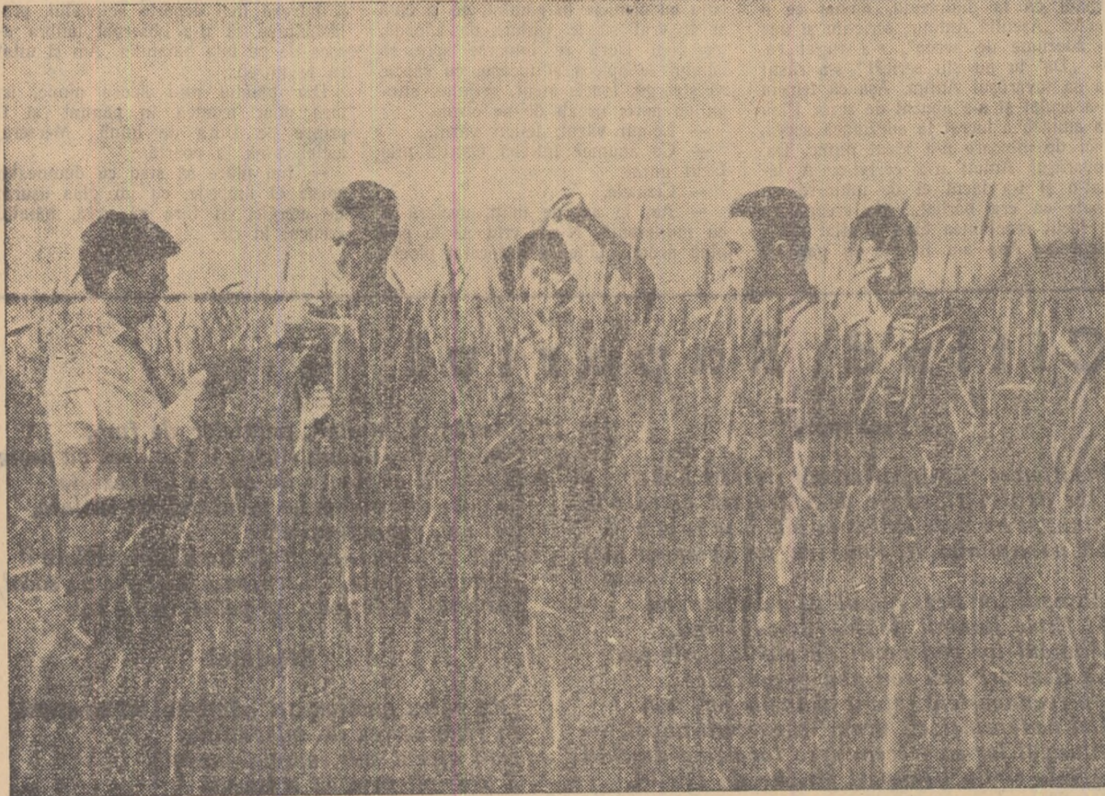
În lațul de secură al gospodăriei.

filmare; se aud interjecții scurte: dușuitul greoi și constant al grupului electrotren și, pe neașteptate, glasul alarmant al rezorului: „Olguța, trafilor! Găinile! Aduceți găinile în cadru!” un cântec de cântec — un cocș șeneț ciugulesc pasnic bălătura din fața buclăriei; îndată se iese un război înversunat; toată echipa se năpustește într-acolo; găinile sînt însă „ale dracului”, vorba unui electrician, nu vor să intre în cadru; cirie; cot-codăcesc; fug; sburătăcesc ca orbeți; sar; se urcă pe acoperșul rezimei; pe stiva de lemne din apropiere... înalt și solid și, ca toți oamenii înalți și solizi foarte serioși, inginerul zootehnist alegea și el după găini, reclamînd liniște și calm și, bineînțeles, mîrînd și mai mult agitația; inginerul șef emite planuri strategice de-nvăluire; jocul îi prinde pe toți și scena e adorabilă prin seriozitatea cu care sar și alți oameni de prin curte „să dea o mîină de ajutor”; planificatorul-șef constituie singura excepție: stă sceptic de-o parte și privește condescendent toată tevatura; deasupra, pe cer, ca un galbenșu răscolit, soarele privește și el, ironic, vinzoleala, lînd mîna sceptică a economistului.