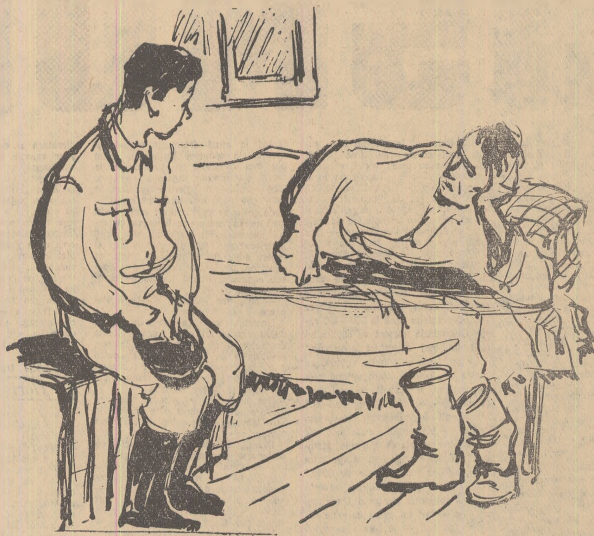
Desen de ECATERINA VLADISCU-DRAGANOVICI