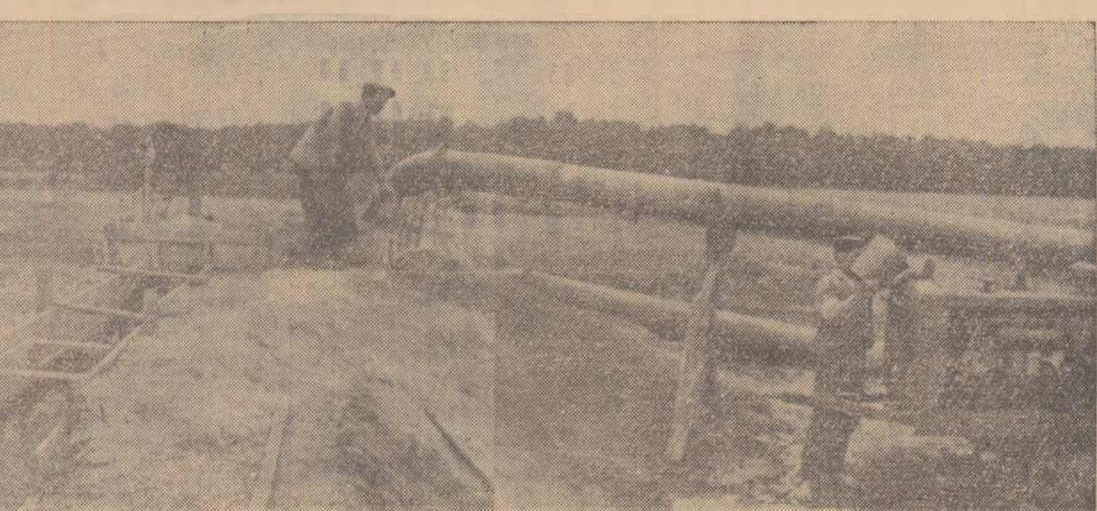
Pompă de irigare a orezului, la o gospodărie agricolă colectivă