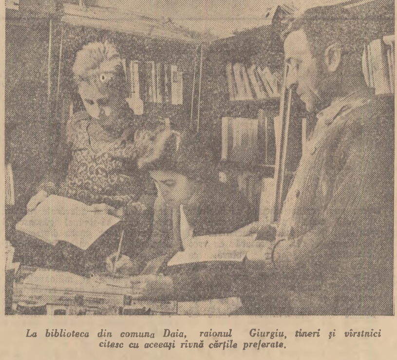
La biblioteca din comuna Daia, raionul Giurgiu, tineri și vîrstnici citeau cu aceeași râvnă cărțile preferate.