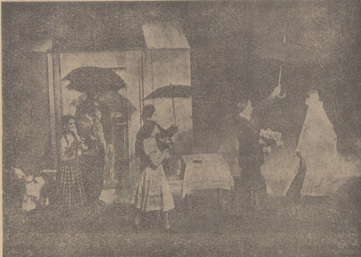
Scenă din spectacolul „Poveste din Irkutsk”, la Teatrul „Vahtangov”.

Sîlul Teatrului „Vahtangov” a atras și un anumit gen de autori dramatici. Resuscitarea rolurilor vechi a lui Arbuzov „Orășul visurilor noastre” datorază viziunii teatrului din strada Arbat, alura sa nouă, improspătarea sa evidentă. La „Vahtangov” această evocare eroică nu s-a jucat la modul evocator. „Cu fața la public”, cu cortina larg deschisă de la început pînă la sfîrșit, pe cîteva practicabile mutate dintr-un colț al scenei în altul a fost relăsat mesajul către cei de azi ai constructorilor din anii primelor cincinale. Actorii au ocupat în întregime scena pentru a documenta convingător ideile dramel. Caracterul aparent fragmen-