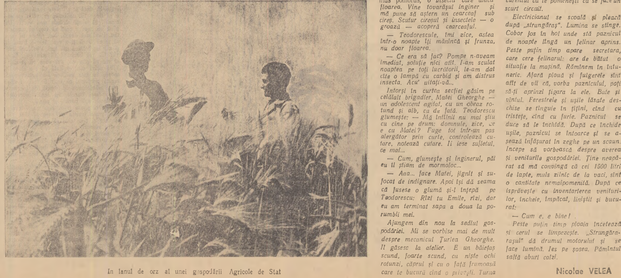
În lanul de orz al unei gospodării Agricole de Stat

Am mers o grupă de ucenici de la gospodărie, din casa în casa și am stat de vorbă cu fiecare. I-am convins repede să ne ajute, pentru că și noi li ajutam de ar: învîdășirile din sat au făcut arăturile cu tractoarele noastre. La 30 mai plantația a fost terminată. După ce mi învîdășăz și alte acțiuni ale tineretului, din gospodărie (plantația a 700 de mii buci de salcîmii pentru tereniile predispușe eroziunii, crearea a 500 metri de gard viu, instalarea de-a lungul șoselei din sat, pe o distanță de un kilometru, a stîlpii de lumină electrică), inginerul își încheie dosarele și pleacă să viziteze gospodăria. Ne îndreptăm spre grădini. Mi arată verzele învelite care-și respiră neglijent foile pe pămînt. Mă previne că acum, în grădini, plantații prin valoare voluntară a suprafață de 50 ha, pe un teren ce nu putea fi dat în folosința agriculturii. La această acțiune am antrenat și pe tinerii din sat. Cum?