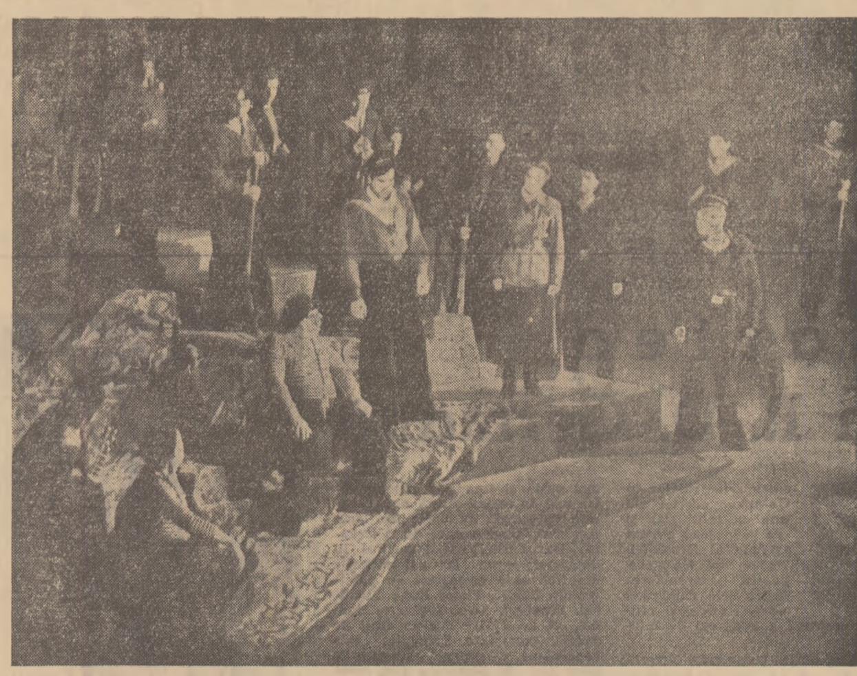
Scenă din piesa „Tragedia optimistă”, interpretată de ansamblul Teatrului Academic de dramă „A. S. Puşkin” din Leningrad