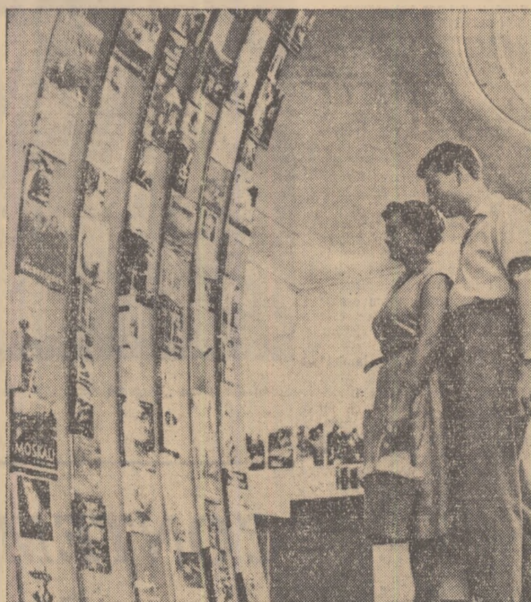
„Colțul cărții din R.D.G.” la Expoziția internațională de la Leipzig