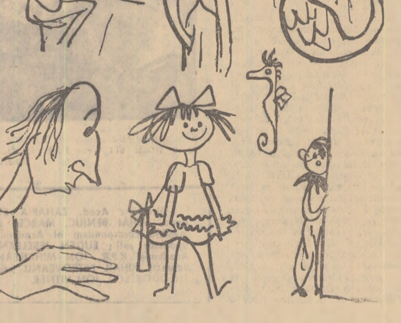
Imagini din spectacolele teatrelor de păpuşi din R.P. Ungară (fig. 1,2,3,5) Italia (fig. 4) şi R.S. Cehoslovacă (fig. 6).