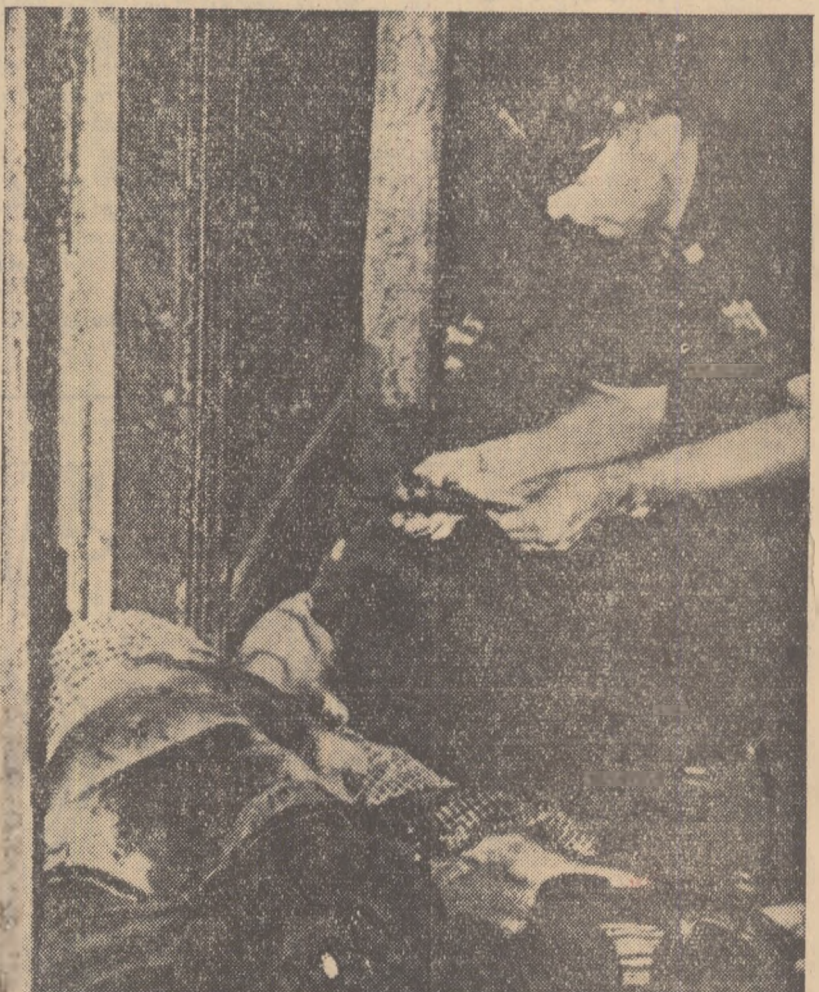
Și o poezie jără „happy-end”. Tîndrul din fotografie a fost ucis de un autocar pe o stradă din New York. Rodele concrete și imediate ale „spălării creierului”

Director: Acad. ZAHARIA STANCU. Colegiul redacțional: Acad. MIHAIL BENIUC, MARCEL BRESLAȘU, EUSEBIU CĂLILAR, membru corespondent al Academiei R.P.R., PAUL GEORGESCU (redactor șef); EUGEN JELEBANU, membru corespondent al Academiei R.P.R., ION MIHAILEANU, V. MINDRA (redactor șef adjunct) MIHAIL PETROVEANU (redactor șef adjunct), CICERONE THEODORESCU, ION VITNER.