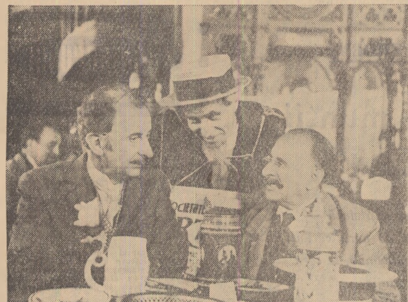
Scene din filmul „Două lozuri”