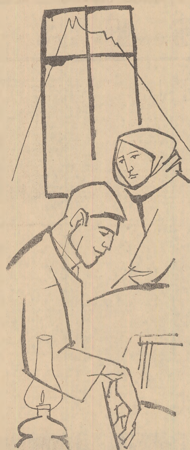
Desen de GETA BRATESCU