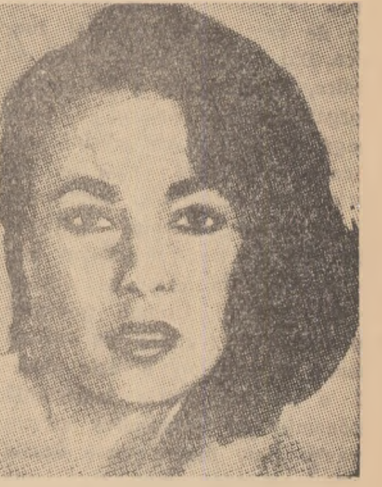
ELIZABETH TAYLOR (S.U.A.)