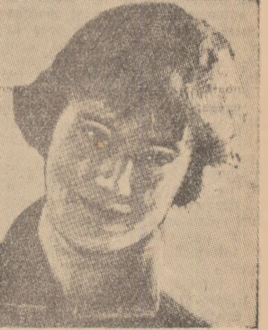
TATIANA SAMOILOVA (U.R.S.S.)