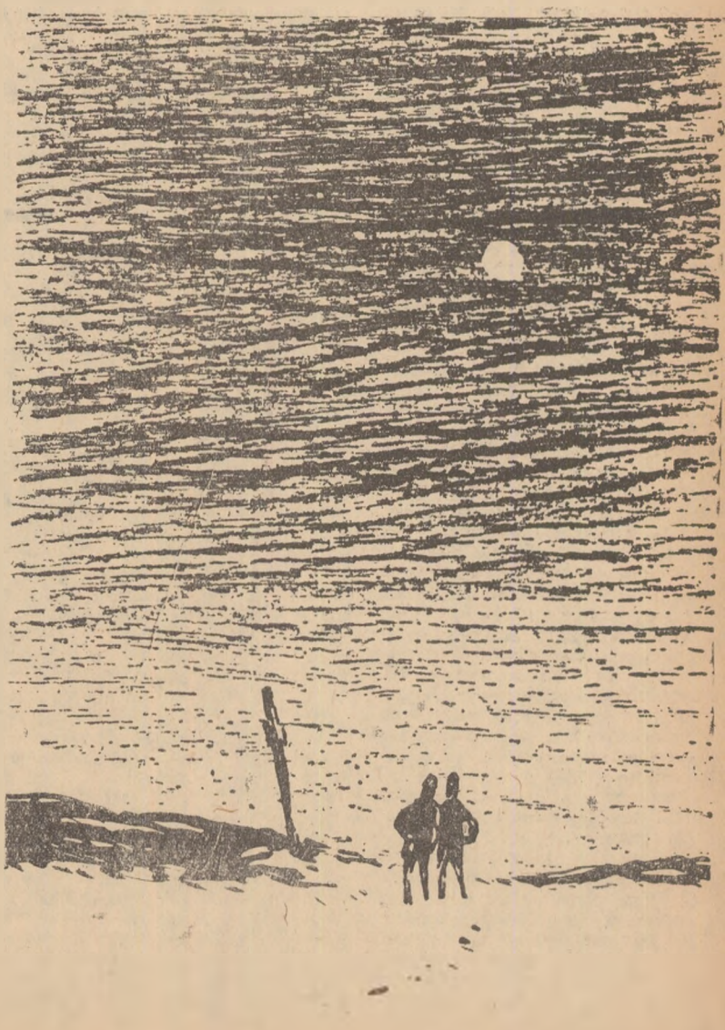
Desene de MIHU VULCANESCU