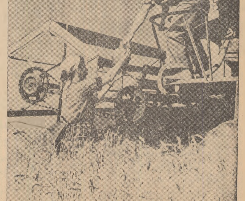
La începutul secerii