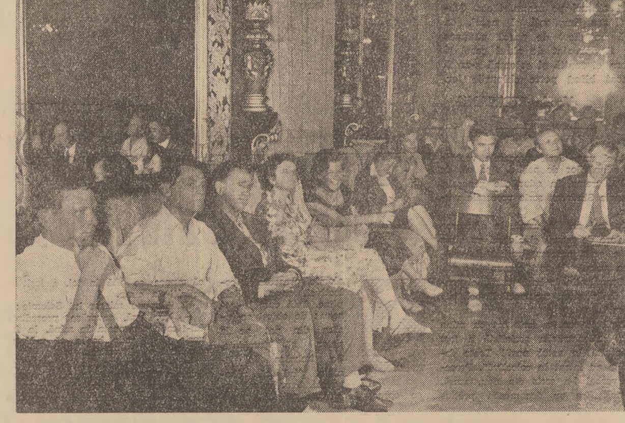
Aspect din timpul conștiinței