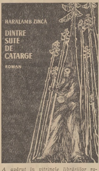
A apărut în vitrinele librărilor romanului „Dintre sute de catarge”, de Haralamb Zinca.