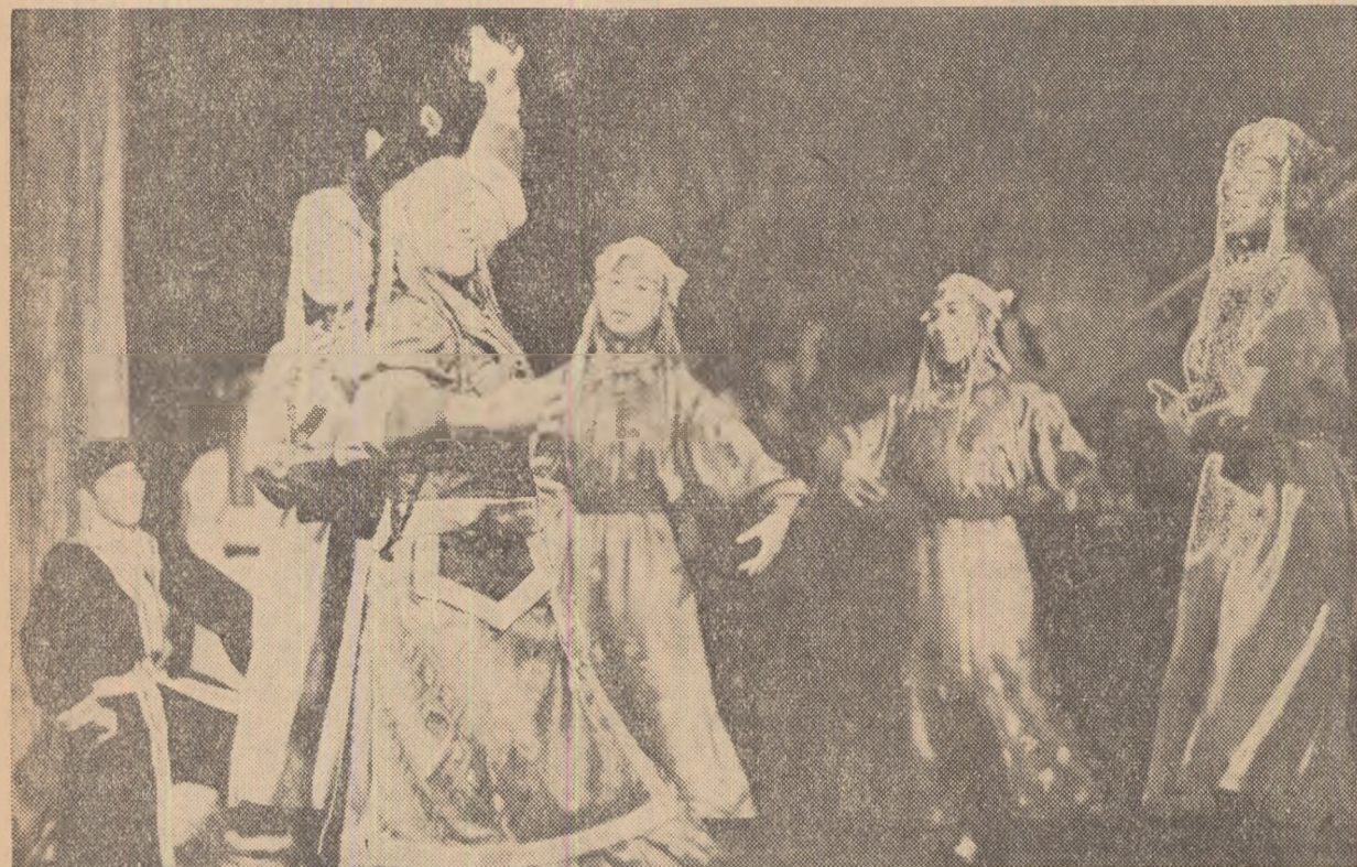
Dans popular mongol, în interpretarea artiștilor Teatrului muzical dramatic din Ulan-Bator.