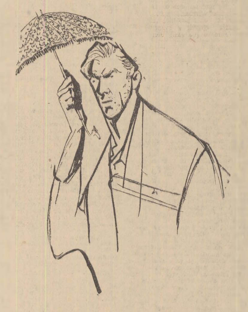
Desen de TIA PELTZ

— De la improprietar... Cînd am împărțit pămîntul boieroaicilor, ea a fugit la București... S-a temut c-o să fie rascoala, ca în 1907... Atunci a ars aici un conac de-al boieroaicilor... Și bunicii lui Ion a murit atunci împușcat. A fugit boieroaica și Ion al lui Roșcovă a intrat în conac și s-a așezat pe divan, și a fumat o țigară boieroaică... Și s-a plimbat prin conac, dar n-a luat nimic, decît umbrela de soare a boieroaice... l-a plăcut