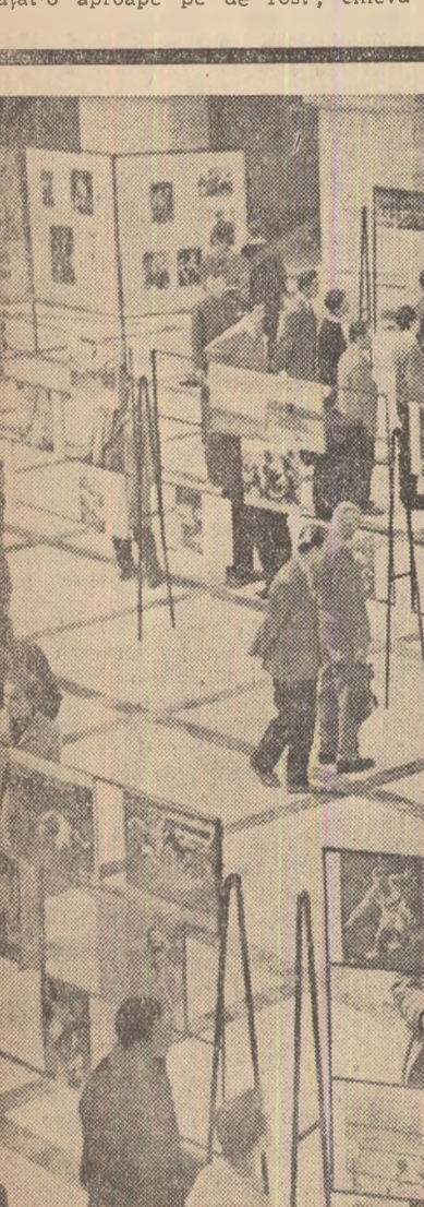
Expoziție de fotografii artistice la Varșovia, deschisă cu prilejul împlinirii a 10 ani de la înființarea Agenției Centrale Fotografice C.A.F.

— Mă așez pe saltea, deși n-ar trebui să fac și spun: — Mi-e rău. Au început durerile. Starea mea nu mai lasă loc îndoielii. Zbirul de la Gestapo trebuie să știe că nașterea este singurul mijloc de a deschide porțile și voi vedea obrazul puțin speriat al responsabilii și fața lăcșoasă, schimonosită de ură a Scharführer-ului: — Was ist los? (Ce s-a întâmplat?) Stiu că așa trebuie să se desfășoare lucrurile, și totuși resimt ca pe o lovitură răcnut brutal ce umple celula. Mă așez pe saltea, deși n-ar trebui să fac și spun: — Mi-e rău. Au început durerile.