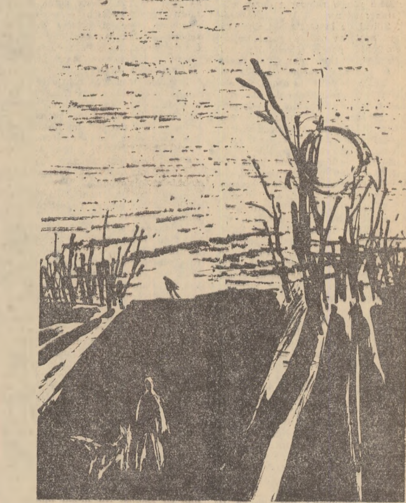
Desen de MIHU VULCANESCU

Pe coama dealului Gusui văzuse satul. Atunci mai începu să înțeleagă ceva. Lumea toată în sat era turburată. Și turburat era și el, dar el nu voia să fie turburat cu ei, voia să fie turburat în felul lui, pe măsura lui, căci el numai pămîntul îl avea laolaltă cu ei, numai uneltele și carul, pentru că sufletul nu-l subserisese la colectivă, — asta era ogrădă lui, casa lui, bălăura lui, unde era domni, și care nu fusese-o frece în inventar, pentru că nu era inventar și le păstra pentru el, ale lui, pe vecie, așa cum știau bine