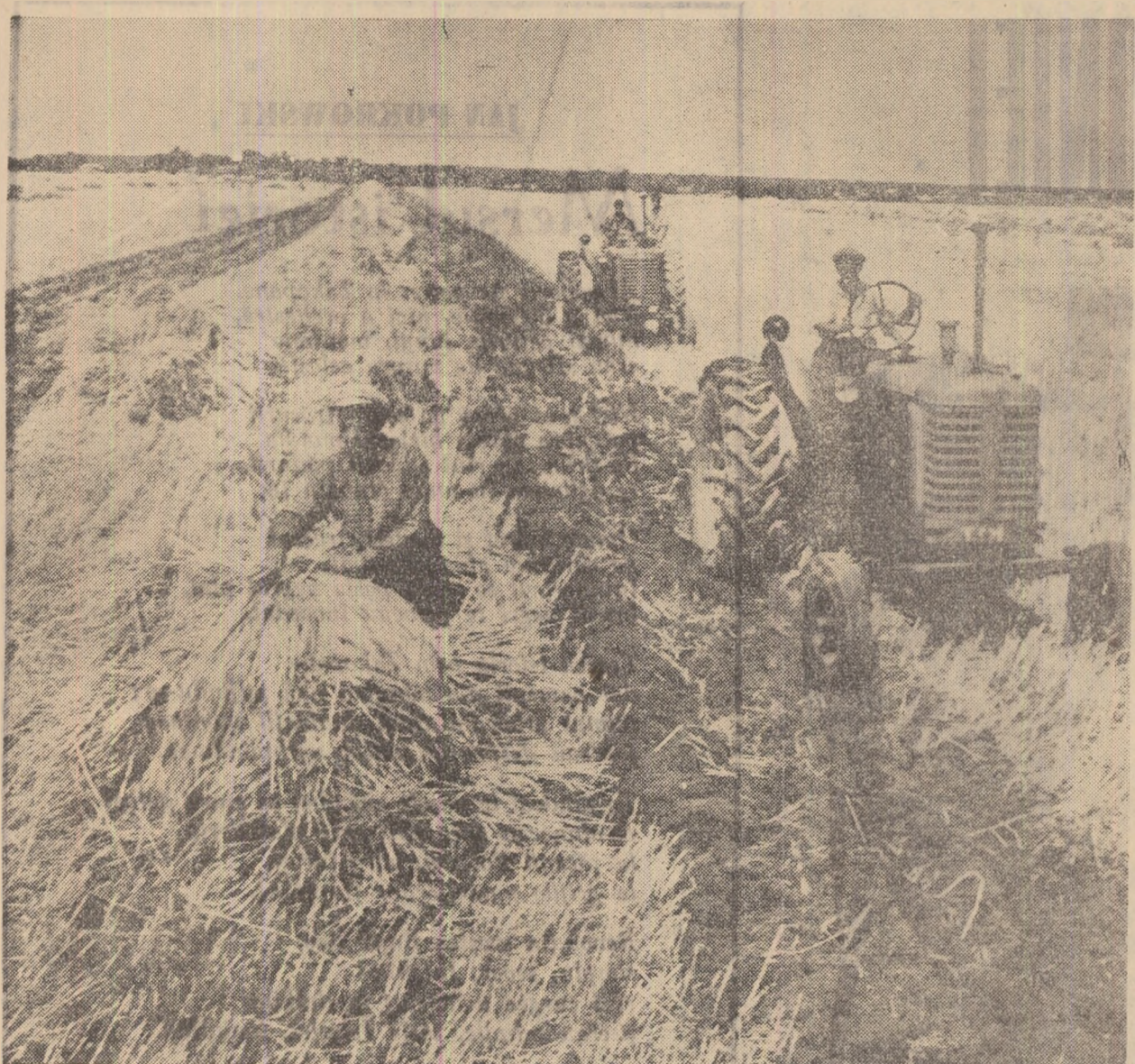
Recolta de grâu n-a fost încă ridicată — și au început pregătirile pentru recolta de porumb-silos din acest an