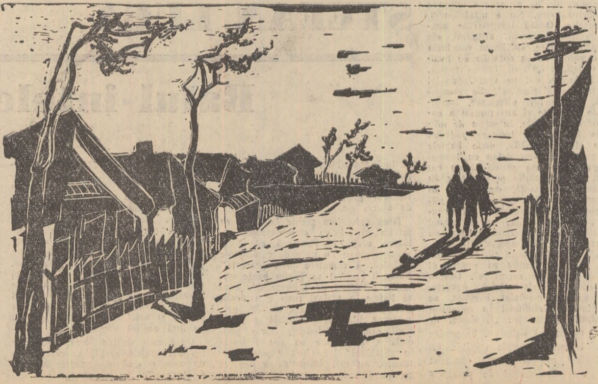
Desen de TIA PELTZ