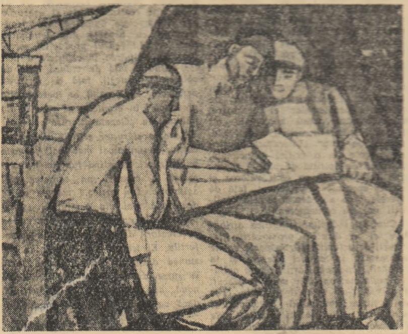
ION SALIȘTEANU (Din „Expoziția regională de artă plastică”)