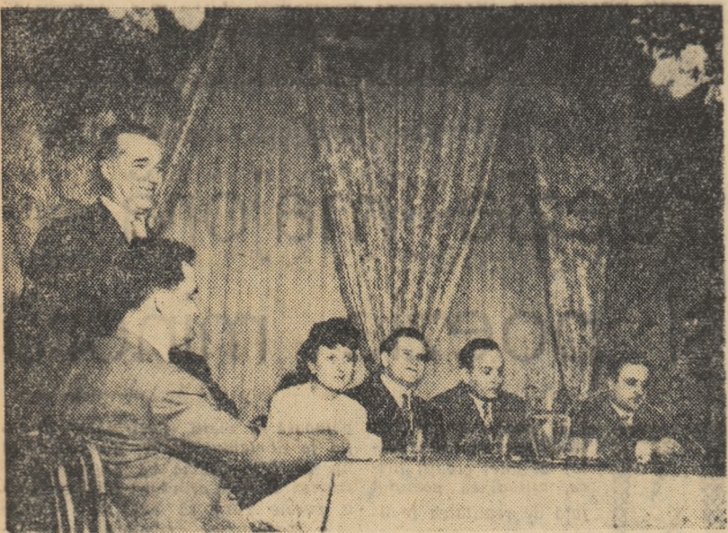
In timpul întâlnirii prietenești de la Casa Scriitorilor