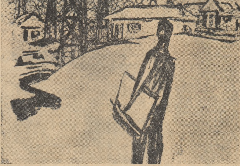
Desen de V. SAVONEA

Toți zîmbesc. Arsene se uită la mine admirativ: „Ați văzut ce poate? Nu se lasă, e dat dracului Petrică al meu!” Petrică a observat privirea lui Arsene și e fericit: cu el, colegul de bancă se poartă aspru, spune mereu că „dumnealui”, Petrică, ar trebui să fie primul din clasă, nimeni nu are altă timp de învățat. Dar acum Petrică a văzut că însuși Arsene M. Ion I se laudă cu el, și a roșit. Îi face semn să stea jos, dar el se gîndește la altceva și nu observă: în re-grese o să se ofere să-i învelească lui nea Arsene caietul și acesta are să-l refuze. Nu știu dacă Petrică a aflat prea multe despre regi, dar co-legul lui de bancă, omul cel mai serios din clasă, cu vîndicatul lui militar și cu țîntuța lui severă, i se pare probabil mai prevădător decît orice monarh — din cartea de istorie de a treia. Sînt doi Arsene M. Ion în școlă, și pe stăru-te de salarii elevul meu e notat cu 1, dar lumea nu-i spune decît Arsene I, dar lumea nu-i spune decît Arsene I; nici nu bănuiește cît de