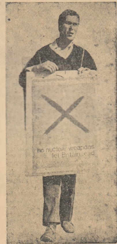
Cunoscutul dramaturg englez John Osborne manifestînd pentru dezarmarea nucleară.

Prima condiție pentru pace este distrugerea miturilor; miturile înseamnă dintru-ncăput război. Într-adevăr, adevarata măsură a omului e dată de muncă pe care el a știut s-o depună pentru a încarna înseși valorile spirituale; iar astăzi, această încarnare depășește pragul individual, devenind un bun al societății. De la umanism individual este necesară integrarea într-un „umanism social”; numai în această amplificare scriitorul poate aplica eterna lecție a umanismului, dacă mai presus de a privilegiu desintegrant, el va reuși să-l prefacă într-o participare integrantă.