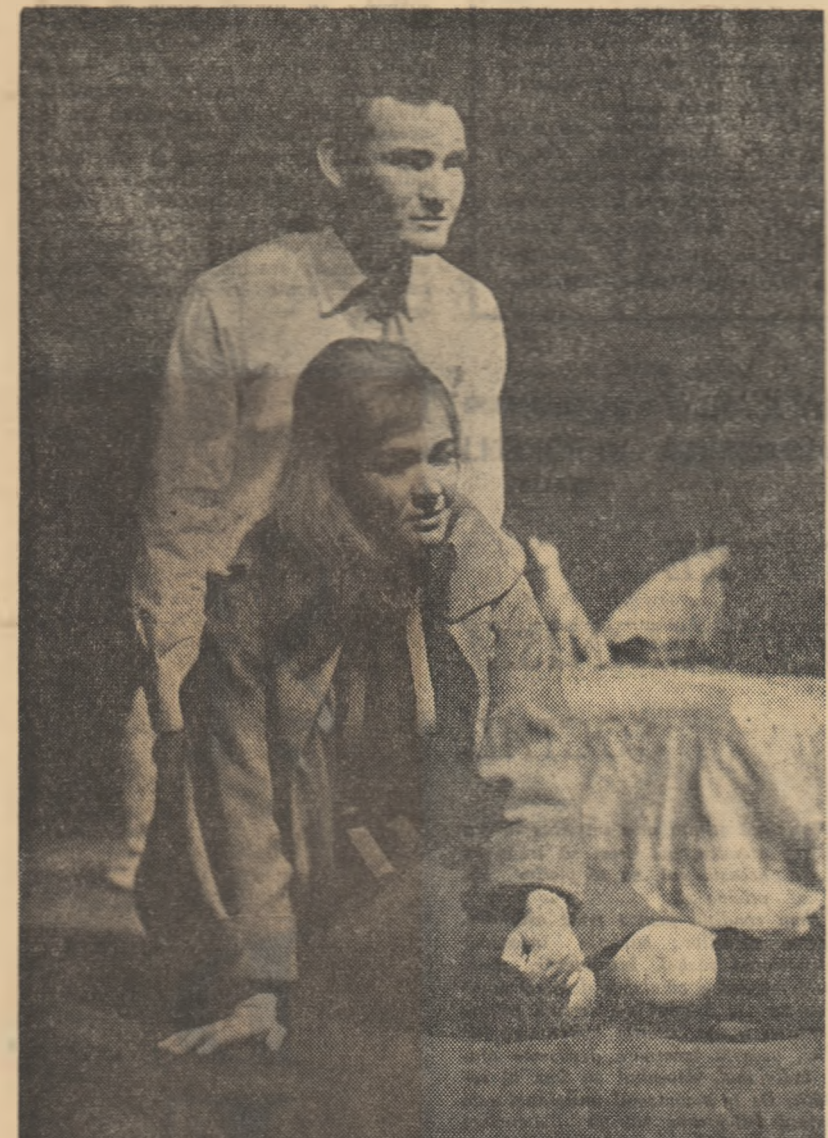
Scenă din spectacolul „In fiecare seară de toamnă”