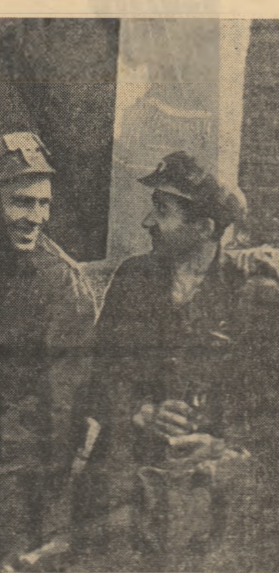
Minerii au ieșit din schimb

De la Petrosani către Petrița alunecă mașina în care călătorim. Rămîn în urmă casele în roșu, fabrica de utilaj minier; trecem pe sub ochiurile plăcii metalice a funicularului, străbatem podul peste Jiu. Ciudad de neagră este apa Jiului. Și totul se amestecă, se asociază: corlele de funicular alunecînd egal pe cablurile