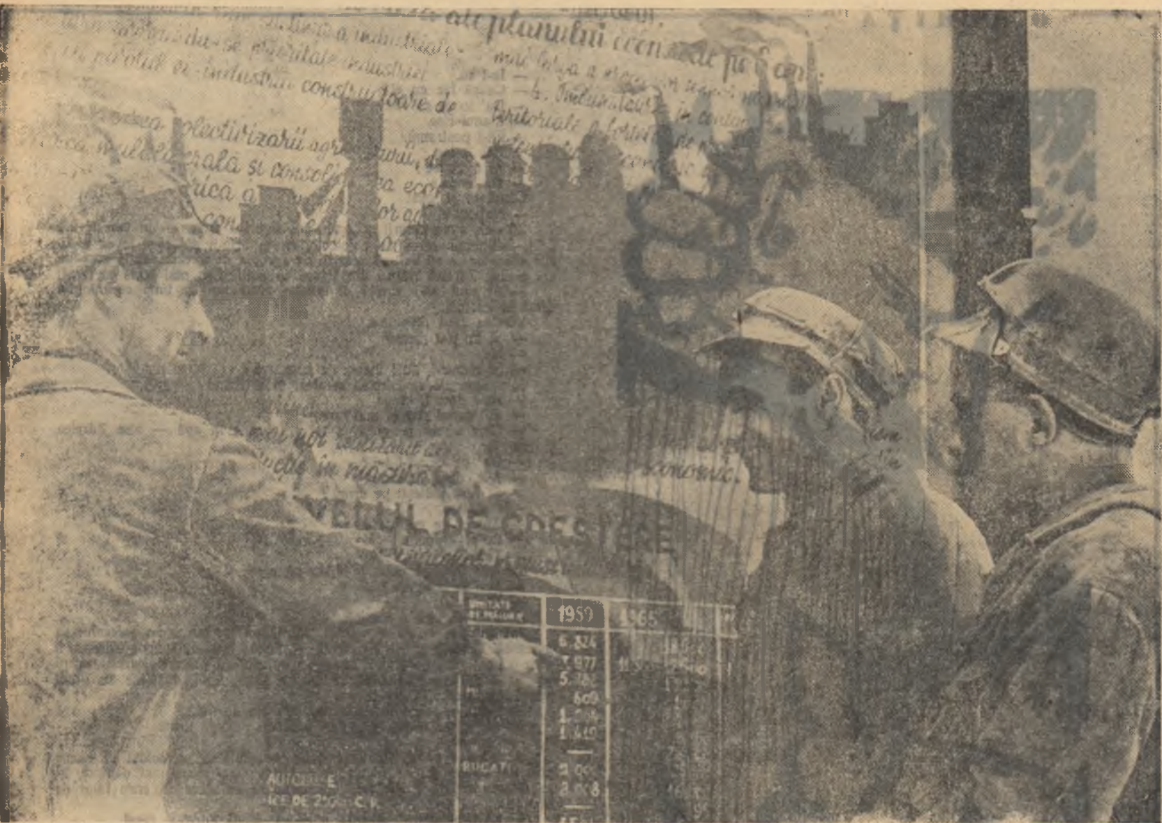
In fața panoului cu rezultatele întrecerii socialiste