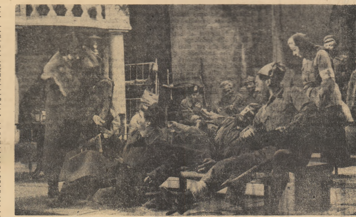
Scenă din spectacolul "Trenul Regimentar"