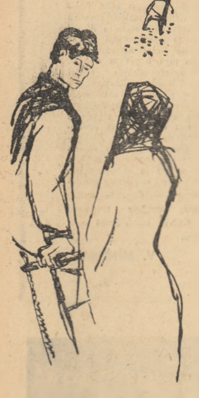
Desen de NICA PETRE

Clopoțe, O, clopoțe adînci de aramă, De ce vă desfaceți aripile negre! E groaznic să-ascuți cum, amar și adînc, Se-nalță iar strigătul fetei ucise Cu darul iubirii ucis — de nimeni în viață iubită. Urletul mamei de-asupra copiilor morți, Geamătul plugarului răpus lîngă plug, Mai groaznic ca unghiiile-mi sfîșie înlma, Ce groaznic, ce groaznic, ce groaznic! Ce groaznic! Încă nu-l vîndecat Rana de-atunci a pămîntului și cald e, încă, De-asupra crematoriului, cenușă, Și peste ruinele-aceor cuptoare În arcuri rachetele zboară, Oamenii Planeta vî cere-apărare, La lupii împotriva călășilor lumii Clopoțe, O, clopoțele-acestea de-aramă! Clopoțe grele din Buchenwald! Sunetul vostru adînc se prăvale ca stîncile munților, Ca vulturii-mi sfîșie înlma, O, clopoțe-adînci de aramă, ce grele Sînt loviturile voastre căzînd din înalturi În hîmple aripile voastre îmi bat Și dîngăne ritmic în noaptea și cîntă amaric, — Clopoțele din Buchenwald O, clopoțe grele de-aramă, Clopoțoi! În romînește de TAȘCU GHEORGHIU