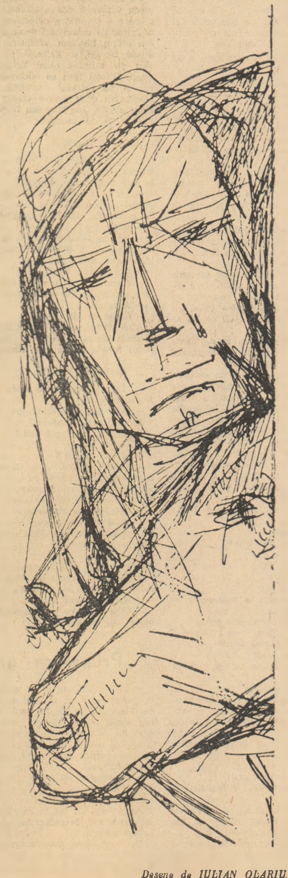
Desen de IULIAN OLARIU.

„În Iunie 1949, după plenara din 3-5 martie m-a trimis partidul la mine în sat. Trebuia să ajut la înființarea uneia din primele cincizeci de