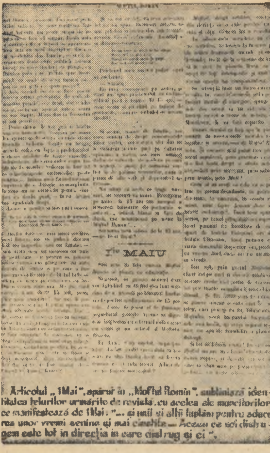
„A-licolul”, „I-Mai”, „opari” și „Moftul român”, subliniază identitatea lucrurilor urmasite de revizual, cu același al muncitorilor ce manifestează de I-Mai. „... și unii și alții lupăm pentru aduce rea unor vremi mai senine și mai cinstite. Acceea ce noi citim: gen caile tot în direcția în care distrug și ci...”