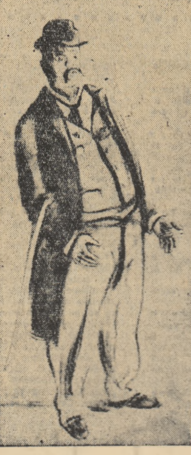
Cetățeanul turmentat Desen de A. JIQUIDI

Cu studiul amănunțit al graficii sociale de la începutul secolului nostru (și chiar al aceluia de la sfîrșitul secolului trecut) se scoate în relief înțelegerea pe care scriitorul Caragiale a avut-o asupra caracterului politic și, în consecință, a deșănțării de ziar. Primul an de activitate al lui Iser, Manu, Ary, Murmu, Ștrabo, și apoi al lui B'Arg, pentru a nu-l mai aminti pe Jiquidi, se desășoară sub semnul acestei valoroase influențe.