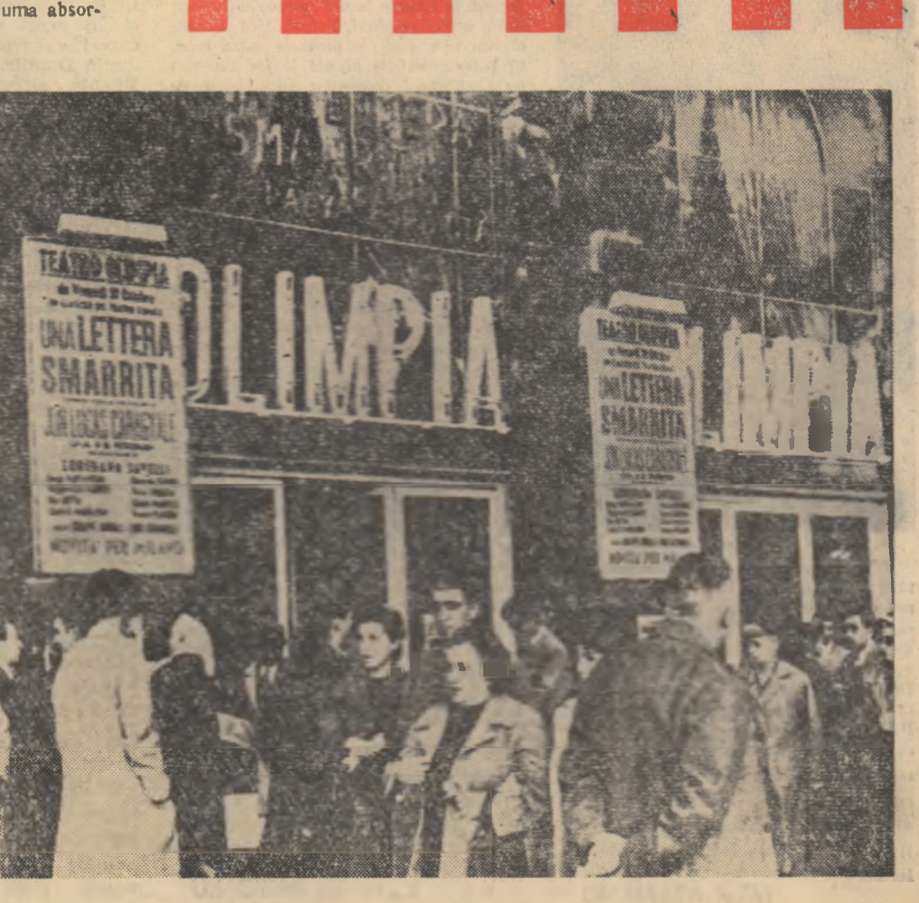
La Roma, în fata Teatrului „Olimpia”, în seara premierei piesei „O scrisoare pierdută”