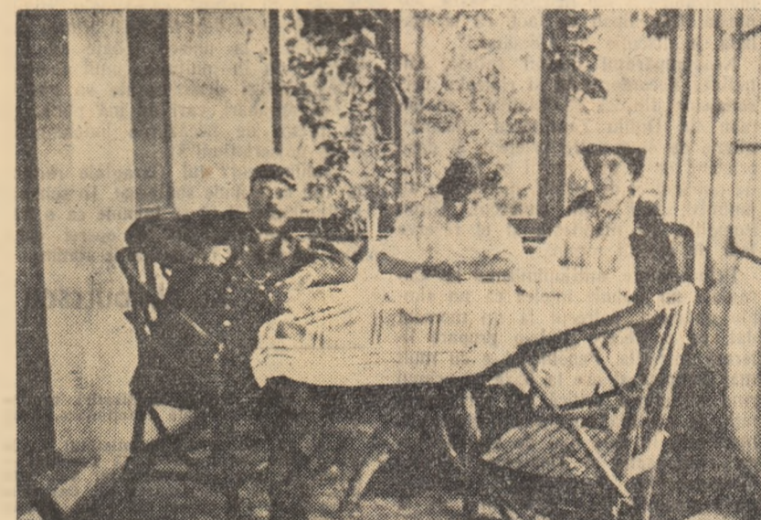
Caragiale în mijlocul familiei