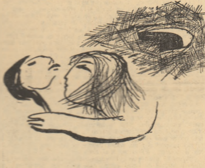
Desen de NICA PETRE

Să vorbim cu minerii, să ne rugăm de ei frățește — doar și ei umblă cu stele prin întineric — poate ne scot pentru noi un filon întreg, un filon mai mare și mai negru,