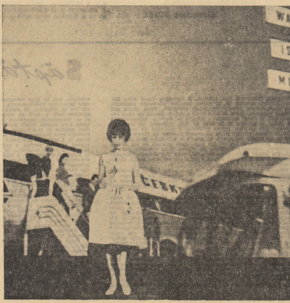
MOMENT DIN SPECTACOLUL „LANTERNA MAGICA”