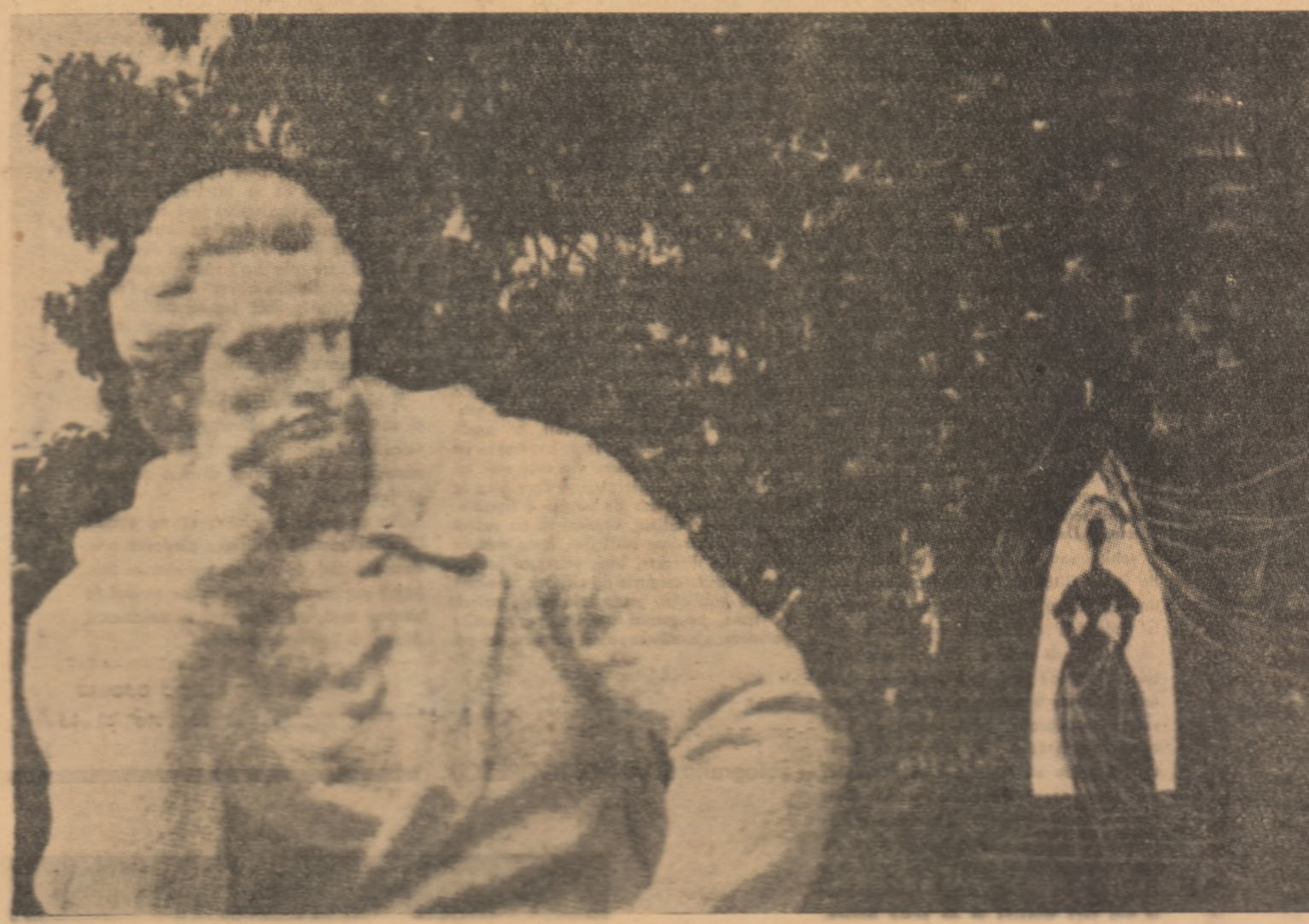
Sculptură: CONSTANTIN BARASCHI. Desen: RADU GEORGESCU

80 de ani de la publicarea poeziei „Luceafărul”