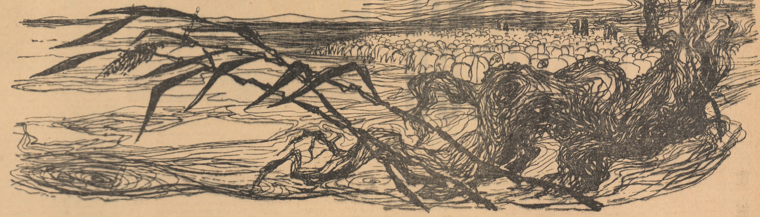
Ilustrație de MARCEL CHIRNOAGA

pentru se afla în baltă Dunării un număr de 1500 de bătăi care stau în pericol iminent de înec din cauza apelor în creștere. Animalele sînt în- conștrînte de ape nu se pot salva decît pe cale aeriană (heliicopter).