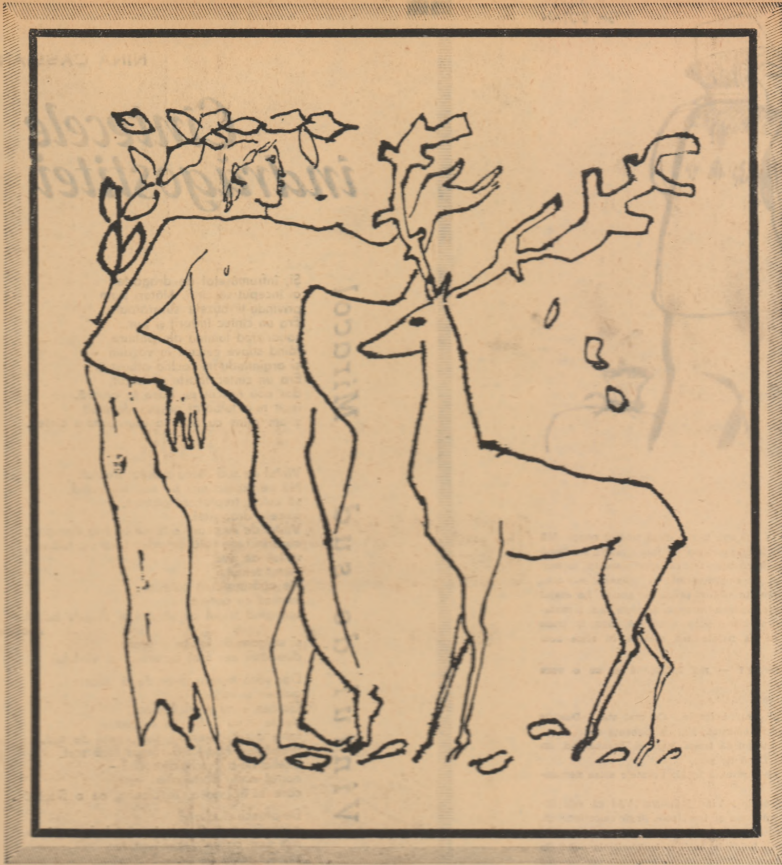
desen de ion vlad

Am tresărit deodată ca și cum o vietate s-ar fi dințit din umbră și ne privea tăcută dar atentă