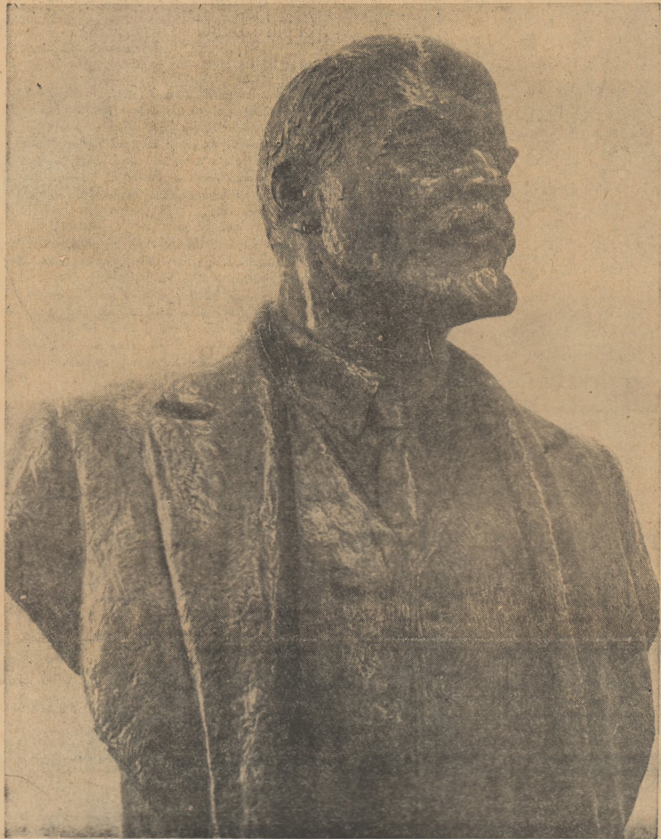
sculptură de Boris Caragea