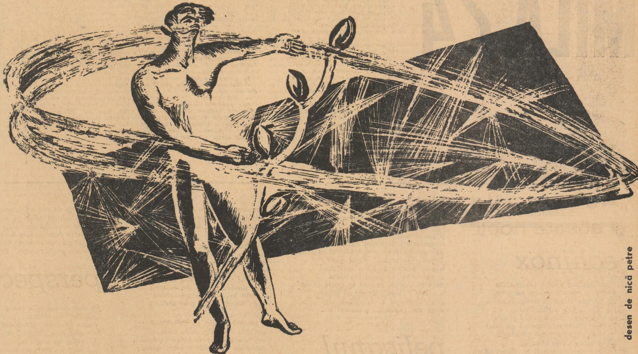
desen de nică petre

În timpul nostru încă alțea sînt de spus ; Cu gest de macarole mă-nalț, mă-nclin supus Ca să transmit prin spațiul și timpul ce mi-e dat Pătrate mari de soare ce-n mine le-am tăiat.