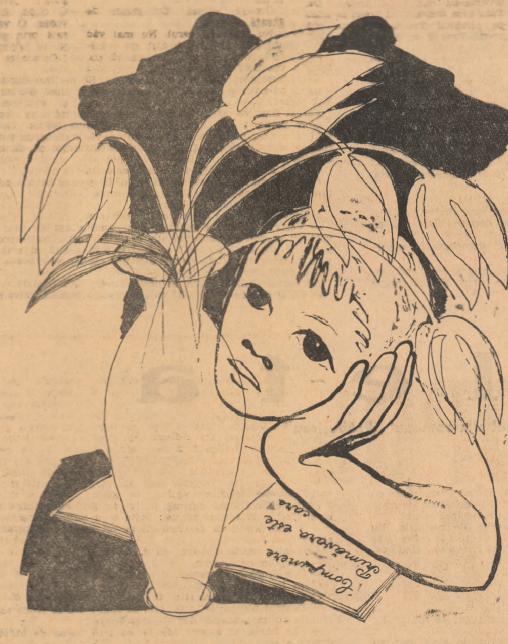
Desen de MARCEL CHIRNOAGA