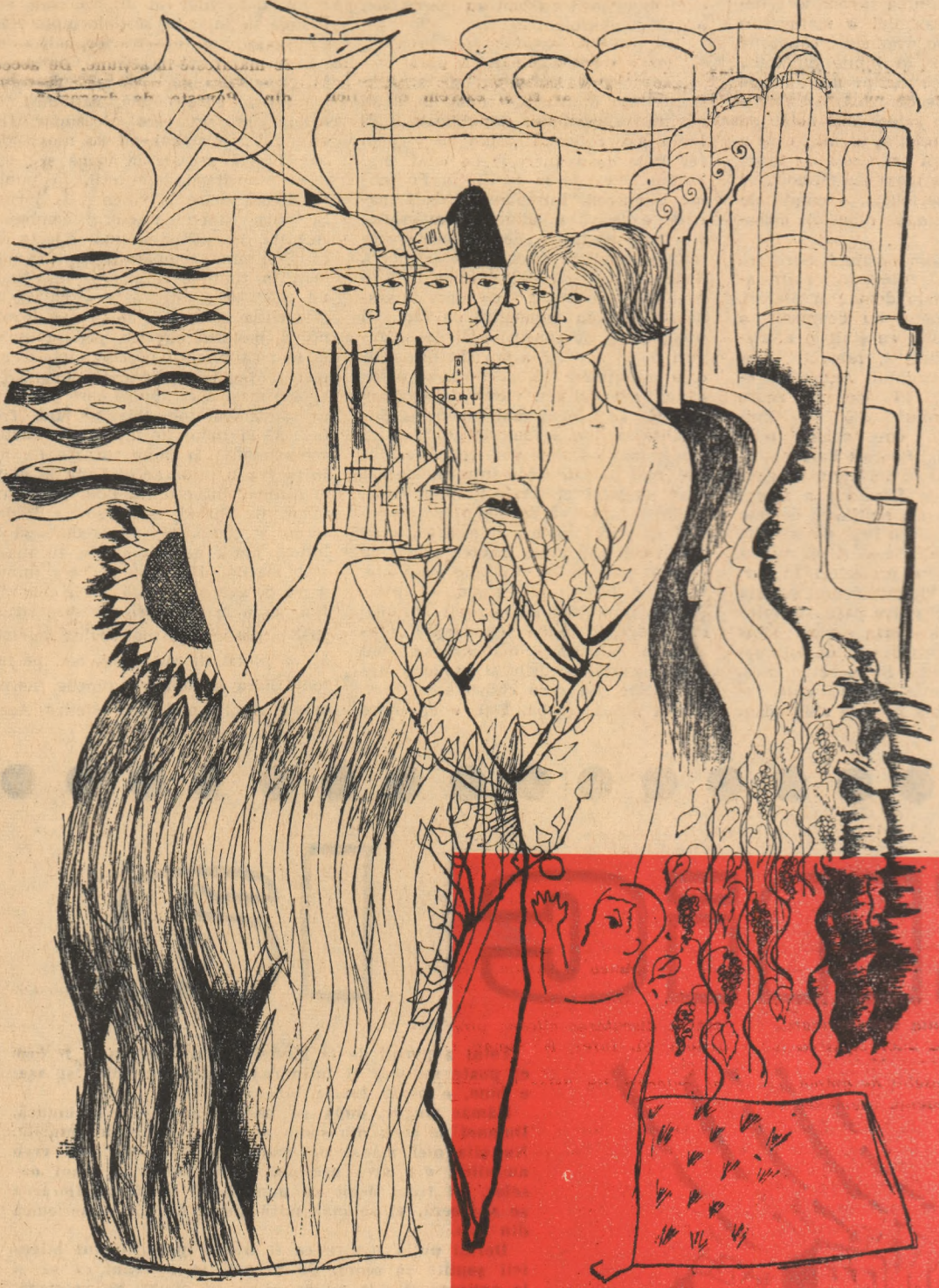
Desen de VICTOR CUPȘA

Cine sint eu? Sună-ți cîmpiile... Cine sint eu? Mingie-ți munții... Cine sint eu? Contemplă-ți orașele... Cine sint eu? Privește-ți uzinele... Cine sint eu? Adulmecă-ți ierburile... Cine sint eu? Ascultă-ți primăverile... Cine sint eu? Privește-te pe tine însăși. Al tău sint Patrie Dintotdeauna.