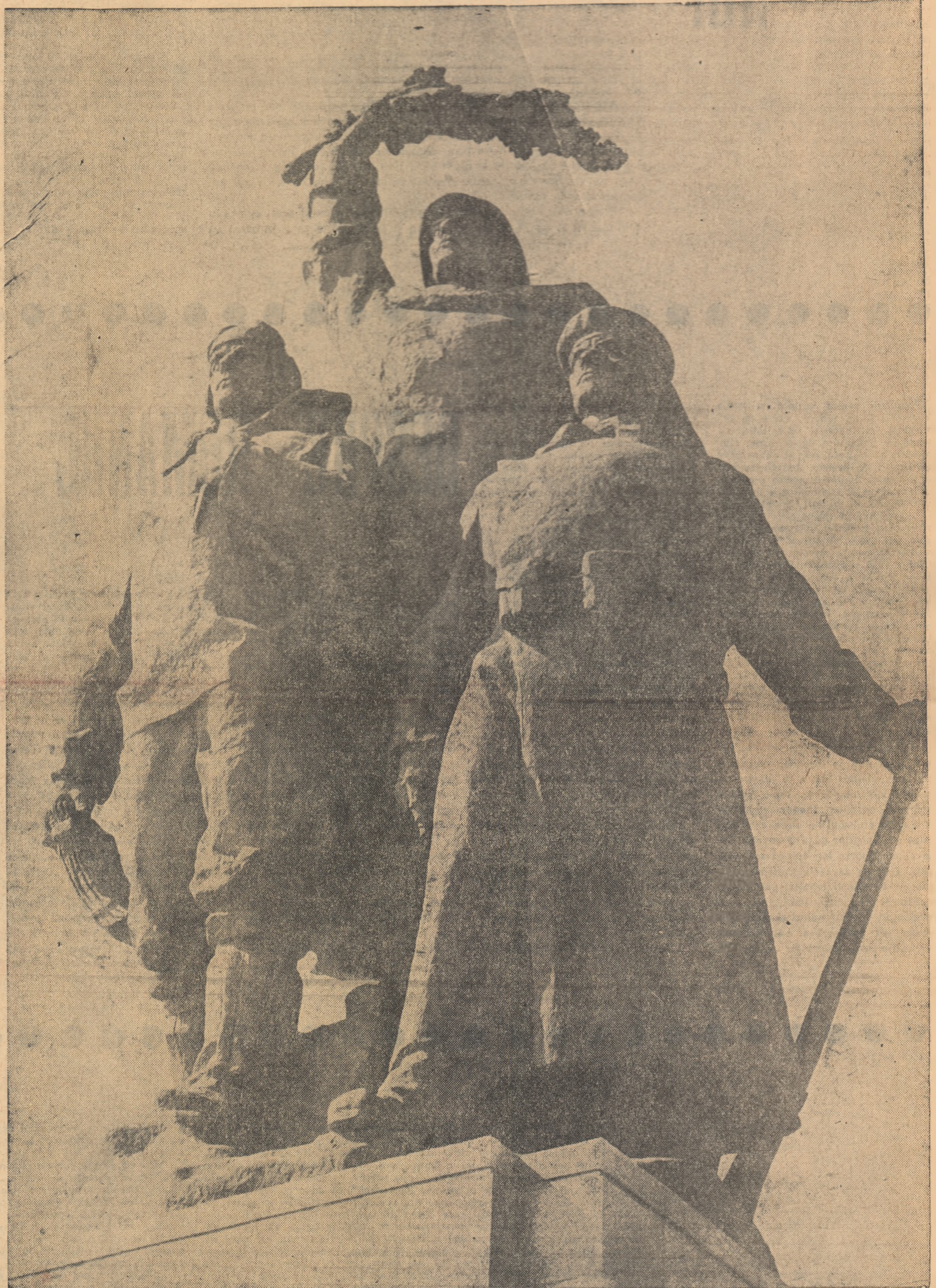
MONUMENTUL EROILOR PATRIEI