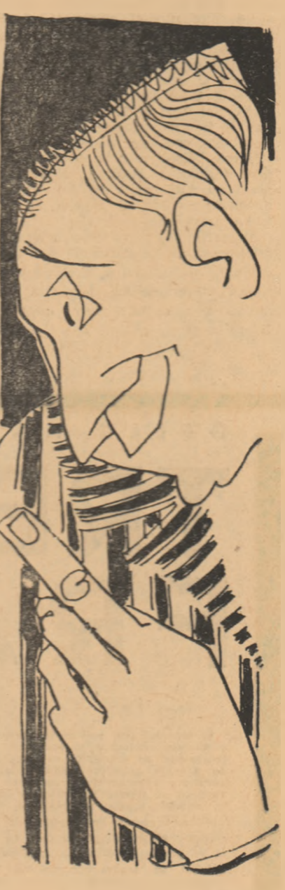
Desen de TIA PELTZ