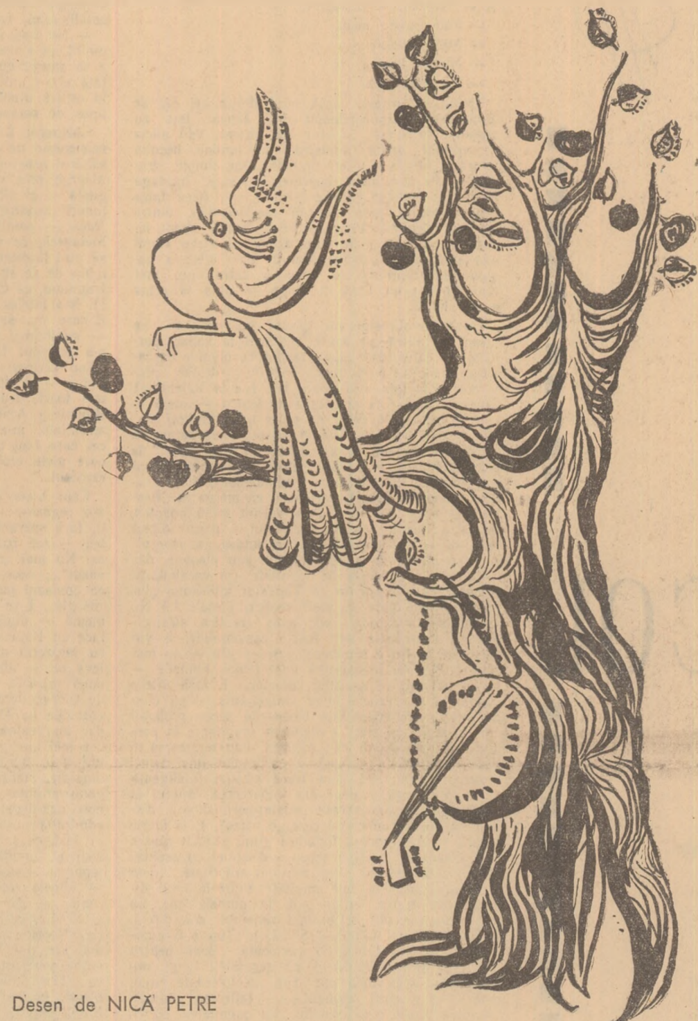
Desen de NICĂ PETRE

Să-și trăiască traiul și să-și ...BEA mălaiul !