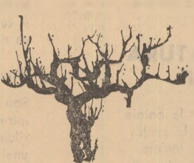
Din volumul „Ultimele sonete ale lui Shakespeare” — Traducere imaginară —