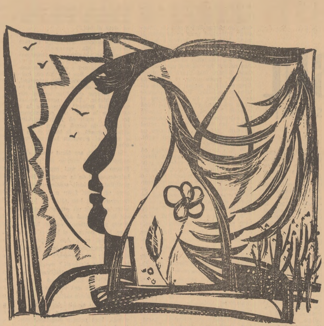
Desen de MIHU VULCANESCU

Dar nu a fost numai asta. Cînd totul părea un hău alunecos și avid, cînd Fiera gonea peste lume, năruind temeliiile, eu am atîns zdrențele lor, obrajii lor cenușii, scofiliciți,