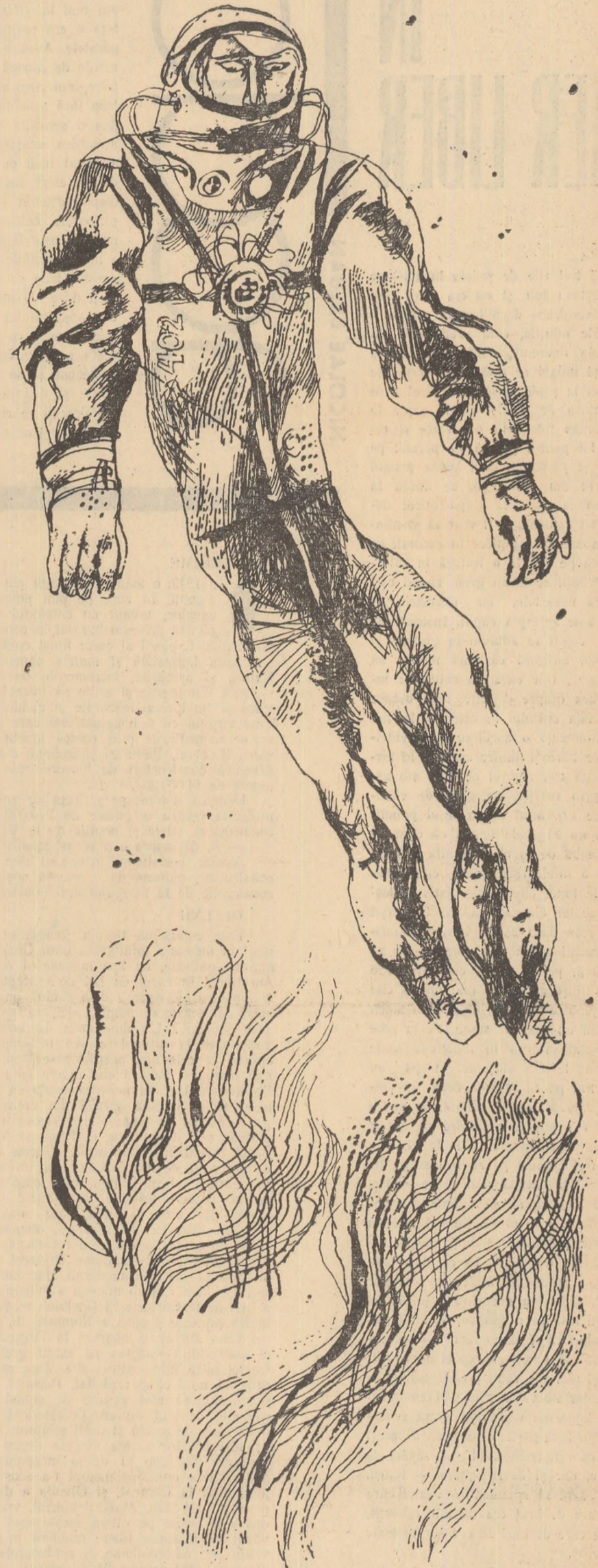
Desen de POMILIU DUMITRESCU

Povestire de anticipație de VLADIMIR COLIN