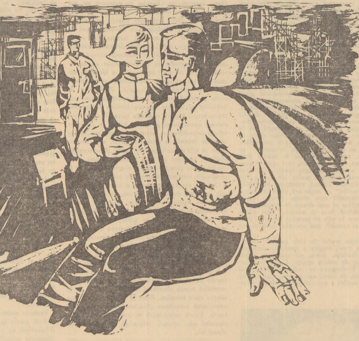
Desen de MIHU VULCANESCU

— Imi zicea o dată: „Mă, știți de nu vă merge vouă bine cu betonarea? Că vă taie drumul pisica!”