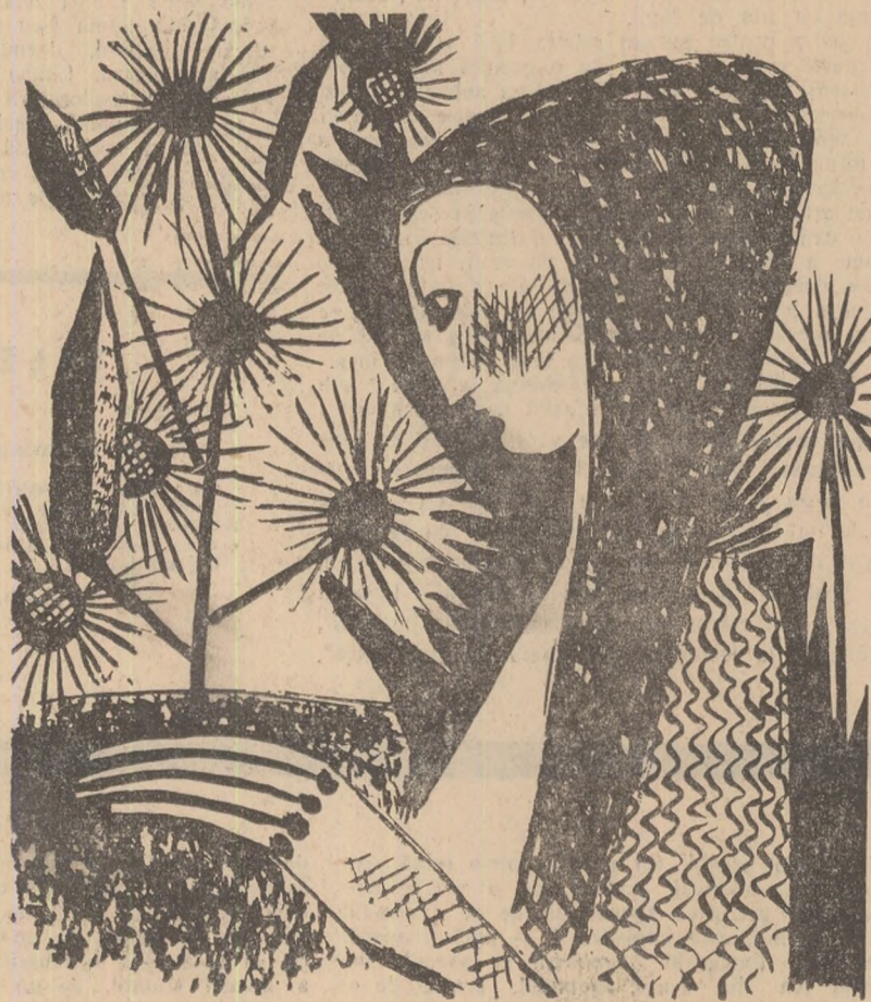
EUGEN CRĂCIUN: FATĂ CU FLORI