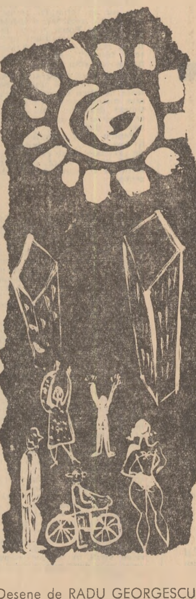
Desene de RADU GEORGESCU

„A plecat! Vezi, iar a plecat şi n-o să se mai întoarcă”. Mă ţinea de re- verul hainei. Faţa l se schimonosise şi atunci am crezut că suferă într-adevăr şi m-am înduioşat. L-am luat de braţ, şi ieşim. „A plecat de tot! Asta e!” S-a repe- zit în camera vecină, apoi s-a întors. S-a lăsat în genunchi să se uite sub pat; s-a urcat pe un scaun, dar gea- mantului nu mai era pe dulap. Avea mîinile pline de praţ, late şi moi, ne- putîncioase. Mi-era şi milă şi mi-era şi scribă. L-am luat pe după umeri şi l-am împins către uşa. Am ieşit în stradă, cerul era albastru. Oamenii căl- cau usor, pluteau în jurul nostru, înalţi.