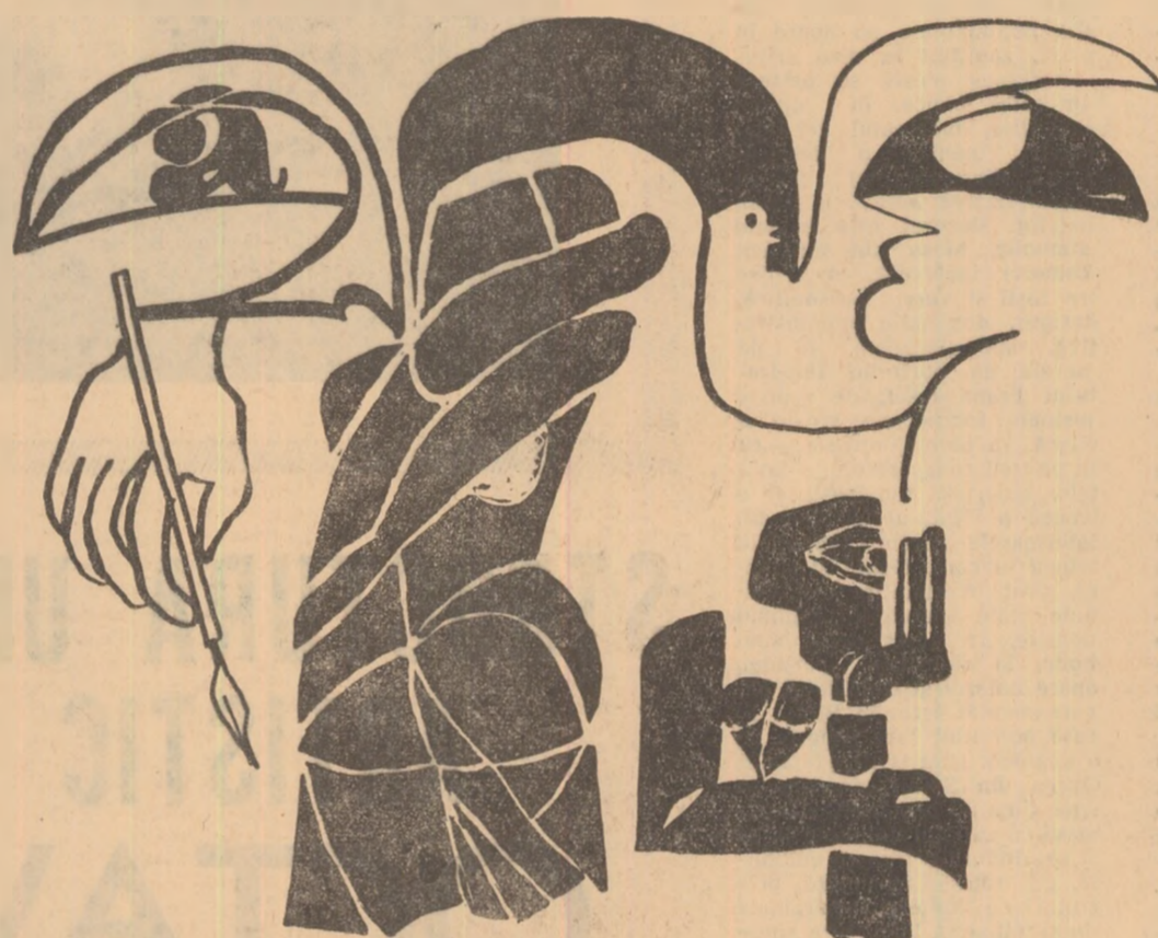
Desen de RADU GEORGESCU

— „Să zbori, vestitor al recoltelor bune! Întorce-te-oricînd și te du înapoi. Tu bolta duratei descui-o și spune de noi.”