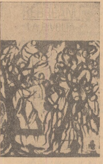
Romanul „Răscoala” de Liviu Rebreanu, apărut de curând în editura italiană „Carabba”.