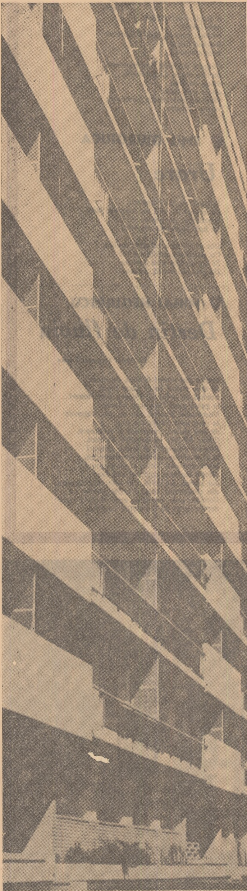
Detaliu arhitectonic pe magistrala Nord-Sud In fotografia de sus: Cartierul Balta Albă văzut din Turnul parașutiștilor

Și mi-am adus aminte de miinile sculptorului, de miinile aceleia mari, încărcate de energie, care au apucat bucata de pămînt galben și i-au dat într-o clipă căldura și miracolul vieții.