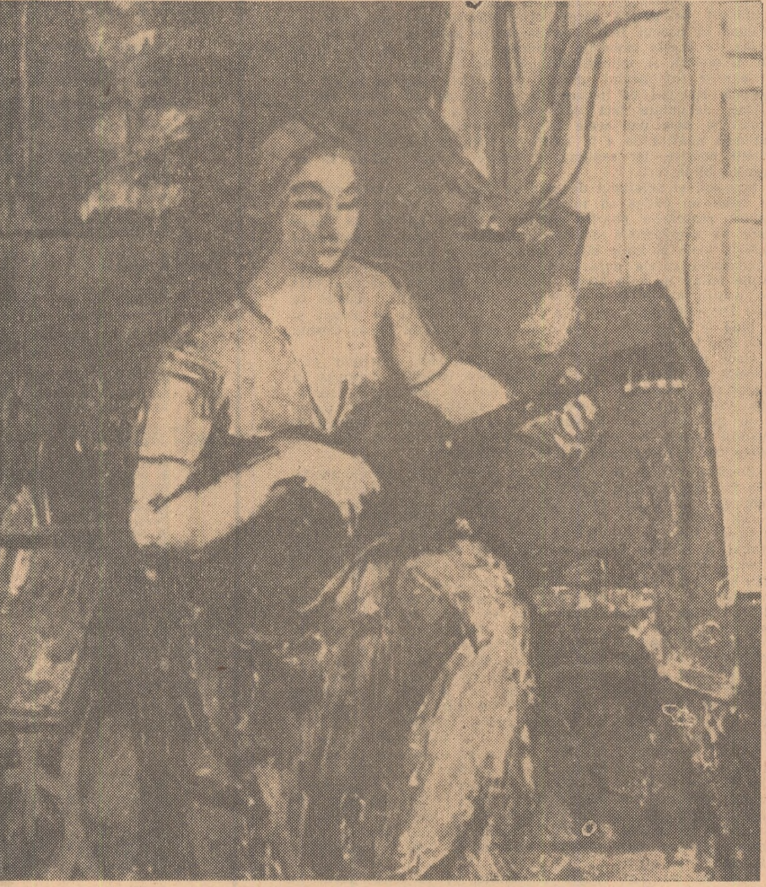
AL. CIUCURENCU Femeie cu gitară (Lucrare prezentată la expozițiile de la Praga și Belgrad din 1964)