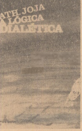
Lucrarea „Logica dialectică” de acad. Athanasie Joja, apărută recent la editura „Fulgur” din Brazilia.