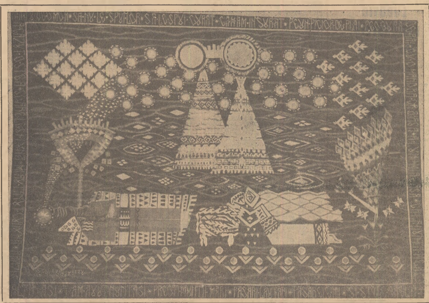
„COVOR” de OLGA PORUMBARU.

ION HOREA DIN DRUM Să fiu acestor timpuri semn În care poți să recunoști De undeva rămas îndemnul Trecut odată peste oșii, Să fiu și eu între bărbaii Al căror gînd rămîne nimb Cînd urcă stoluri de ovații Ca păsările-n anotimp Și trec peste pămîntul țării Și lasă-n urma lor culori, Să fiu un semn al depărtării Și-al amintirii unei. La locul unde se ascunde Netulburată de cuvînt Tăcerea-n pietrele rotunde Și cumințenia-n pămînt, Să spun de porțile săruturi În care dorm nedespărții Părinții mei de la-ncepături De preoții munții mori nuniți. Să fiu bărbatul timp ce-și mino La rîuri turmele din munți, Bărbatul meșter și finit Al cărui zbor îl mai osculți, Să fiu la șes bărbatul fluviu Bărbatul grin, bărbatul fac, Cînd viu spre tine și cînd nu viu, Și cînd blestem și cînd învoco, La locul unde clopotitorul Despre trunchiul din înalt, De unde pasărea-și ia zborul Către tărîmul celălalt.