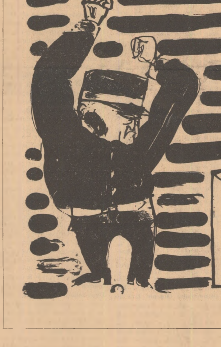
Desen de BISS

Un timp se măsurară unul pe celălalt cu privirile. Deținutul tușea încet, polițistul tușea de asemenea.