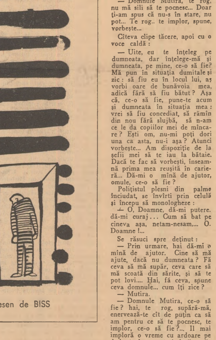
Desen de BISS

Un timp se măsurară unul pe celălalt cu privirile. Deținutul tușea încet, polițistul tușea de asemenea.