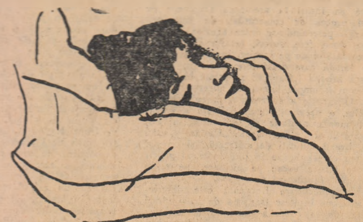
PARASCHIVA — 1912