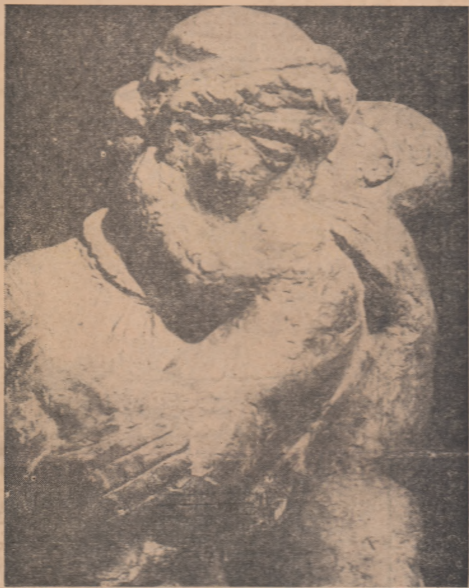
BORIS CARAGEA MATERNITATE (detaliu)