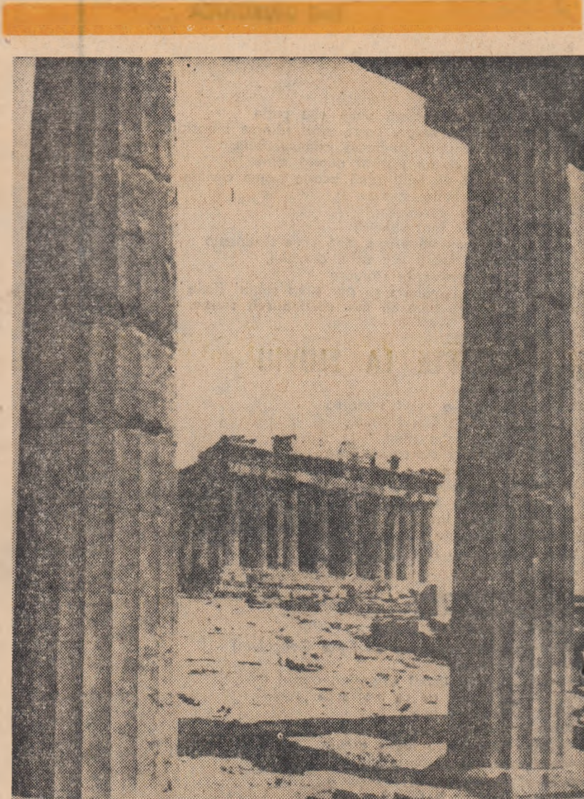
De Acropole, printre coloanele dorice ale Propyleelor, se vede fațada Parthenonului (templul Athenei), construit în timpul lui Pericle între anii 448-438 î.e.n. de arhitectul Ictinos și Calicrate, cu concursul lui Phidias care a decrar frizele. Acest imponent edificiu, sîta de istorie dăruită în marmură, evocă genul creator al vechii Ellade

Atena în august e superbă. Dar o prefer pe cea din decembrie. Îmi place Persephone pe pămînt, dar în