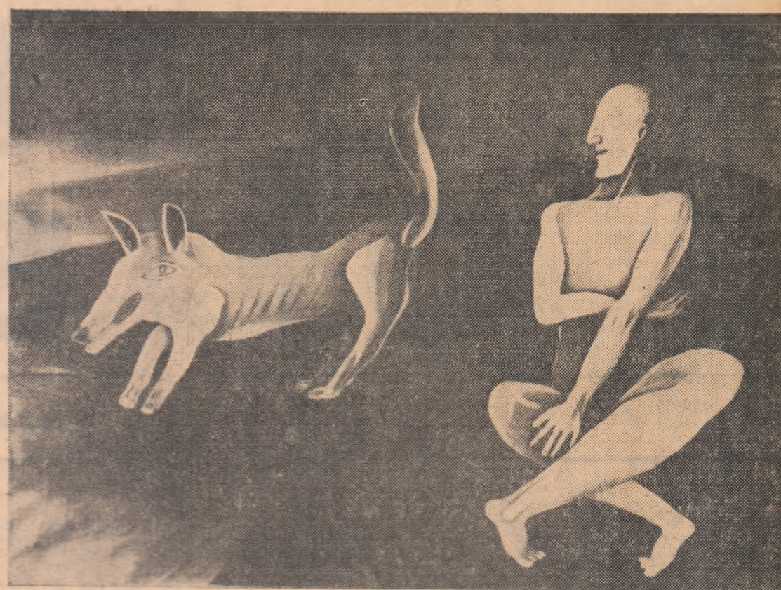
INEDIT: VICTOR BRAUNER