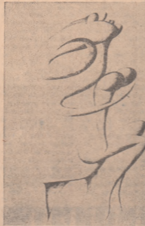
INEDIT: VICTOR BRAUNER (colecție particulară)