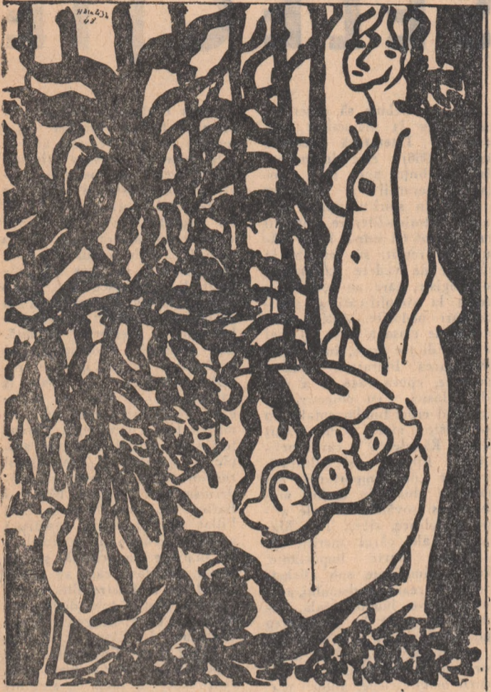
H. MATISSE INTERIOR CU FERIGA NEAGRĂ