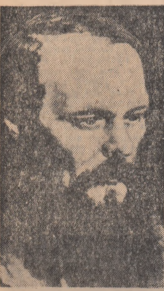
Dacă ne închipuim istoria literaturii ca un traseu feroviar...