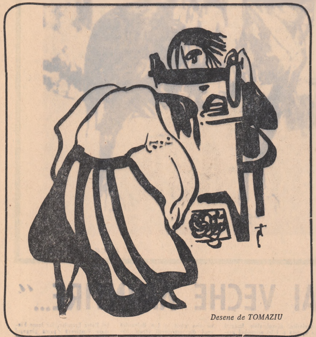
Desene de TOMAZIU

POSTASUL: Săru' mîna și noroc! Să vă trăiască!