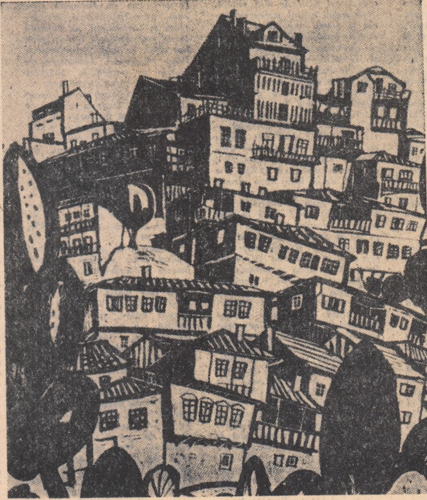
PENCIU KULEKOF, TIRNOVO