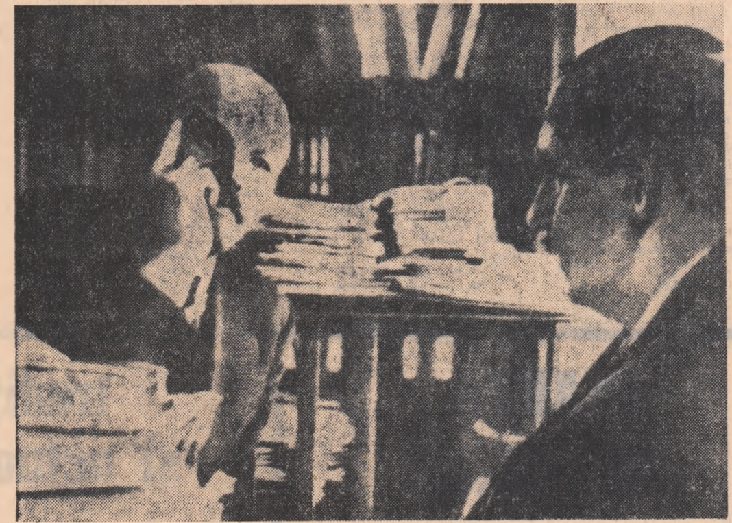
LENIN stînd de vorbă cu H. WELLS

Cărturari iscușiți, artiști de geniu au încercat să-i dăltuiască portretul. L-am ales, spre a-l transcrie aici, pe cel schițat de scriitorul englez Herbert Wells — fantazia cea