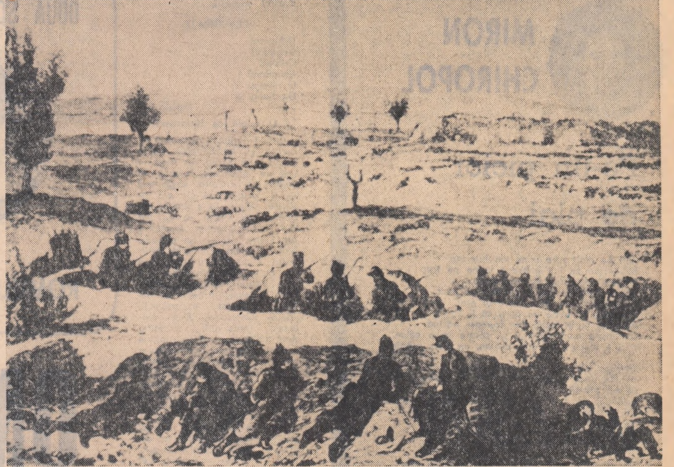
Schimb de jocuri la reduta Grivița nr. 2