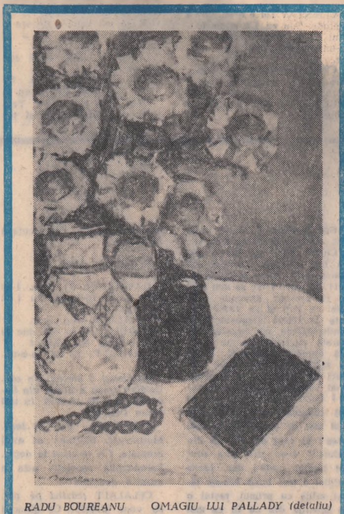
RADU BOUREANU OMAGIU LUI PALLADY (detaliu)