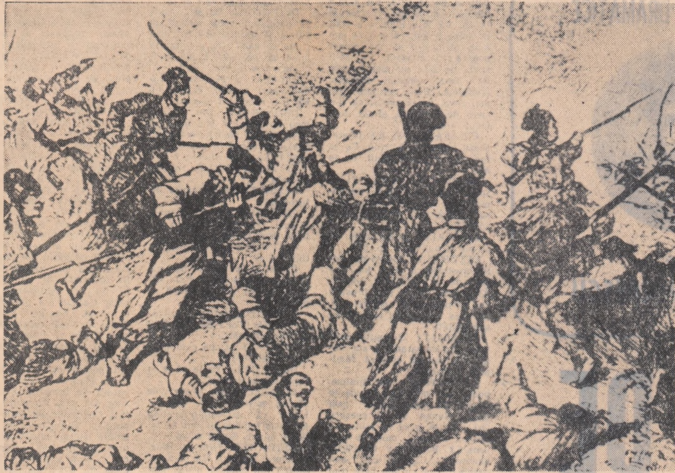
Atacul dorobanților asupra redutei Grivița