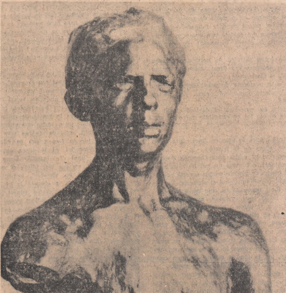
PORTRETUL PICTORULUI DĂRĂSCU

Acolo, în final, acolo în etern Spre piinile din lanuri, spre țîneri flintini, Asemeni zeilor prea tineri, m-aș întoarce Să vă îmbrățișez cu Dunărea pe miini.