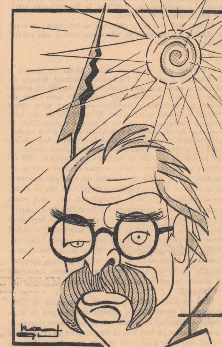
PETRE PANDREA: „BRĂNCUȘI, AMINTIRI ȘI EXEGEZE”