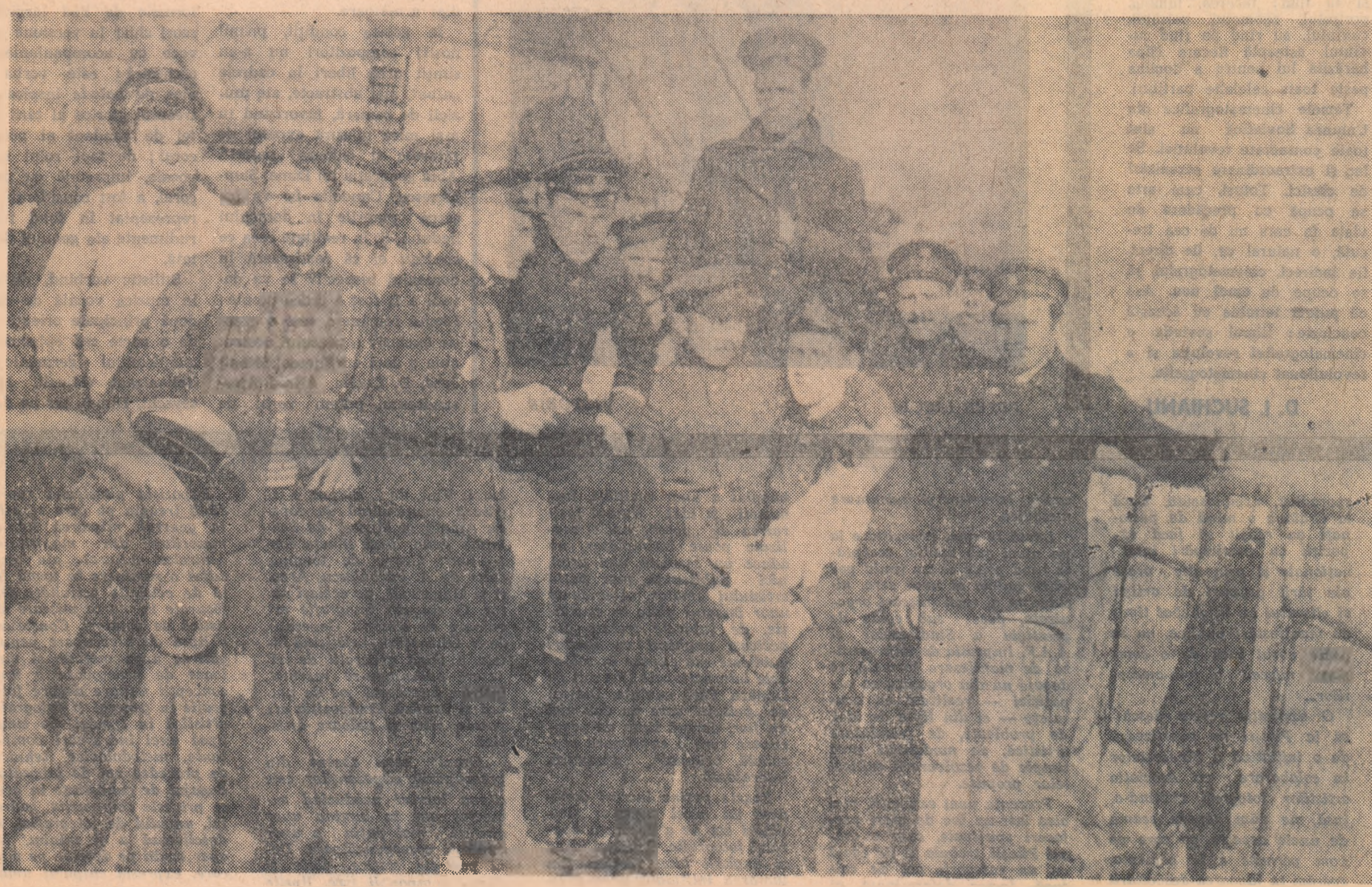
PE VAPORUL „ROMANIA”: MARINARI ROMANI FRATERNIZIND CU MARINARI RUȘI (1917)

roana jos de pe iaht. Iahtul regal era confiscat de Comitetul revoluționar rus, ne-a fost predat nouă și ni s-a spus să plecăm cu el pe Marea de Azov. Cum vasul nu avea compas, nimic, a trebuit să mergem cu el pe marginea mării și ne-am ținut așa pe lîngă țărm pînă am ajuns la Nikolaevski. Aci am primit dispoziție să intrăm pe Nipru. Am intrat pe Nipru și am navigat pînă la Kerci. La Kerci cînd am ajuns, gărzile roșii ne-au făcut o primire grozavă și s-au rugat de noi să-i luăm să ajungă pe front, pentru că înaintau gărzile intervenționiste nemțești cu rușii albi și cazacii de pe Don și ne-au rugat să plecăm cu ei pînă la Sevastopol. Am plecat deci cu 180 de marinari ruși revoluționari pînă la Sevastopol. La Sevastopol tot orașul era în port. Ne-au făcut o primire frumoasă. Vasul nu mai avea stema regală, filifia pe el steagul roșu și drapelul tricolor. Era elegant, alb, o frumusețe! Nu i se mai auzeau nici mo-