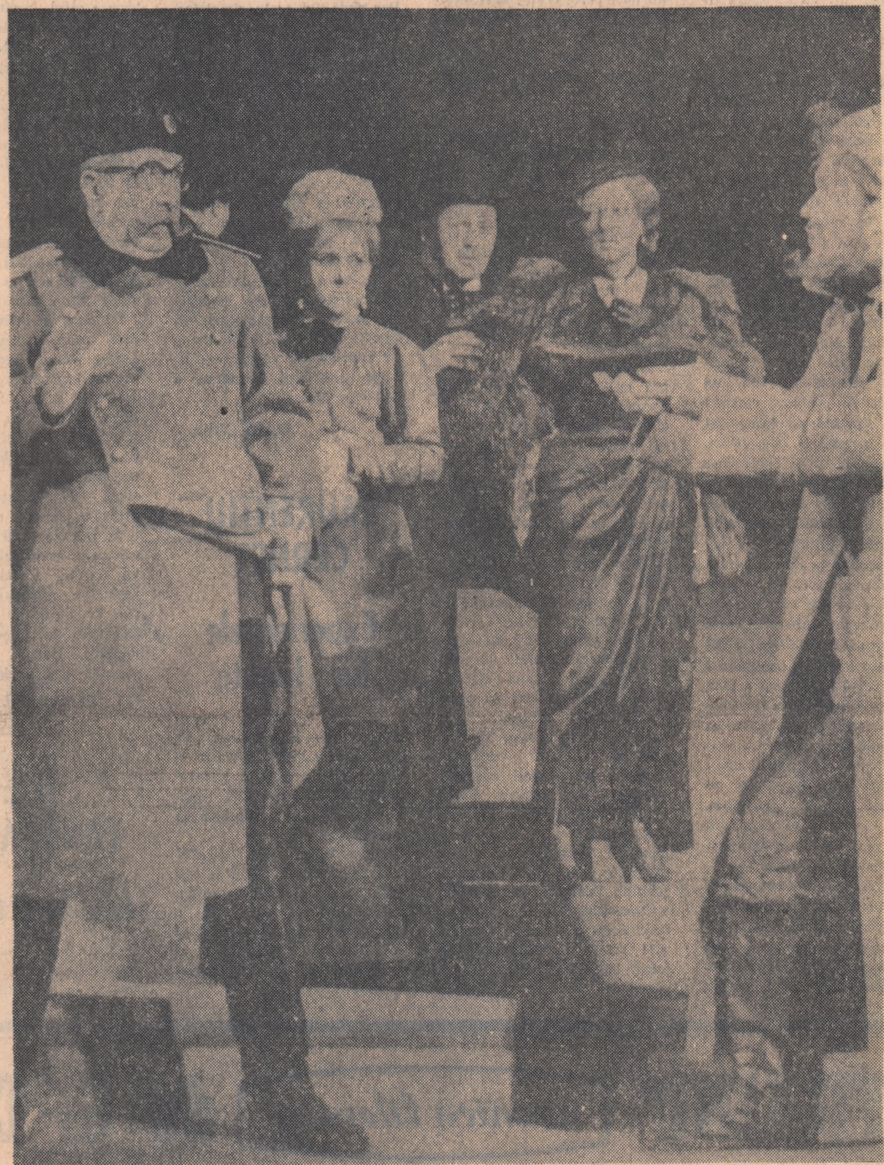
SCENA DIN PIESA „ZECE ZILE CARE AU ZGDUIT LUMEA” ÎN INTERPRETAREA COLECTIVULUI TEATRULUI NAȚIONAL DIN BUCUREȘTI