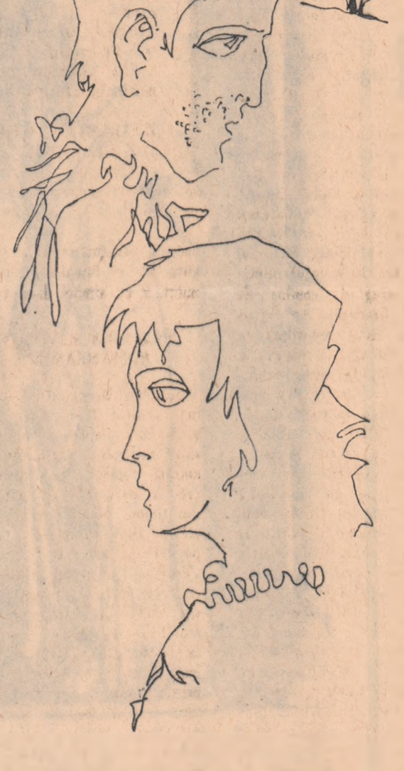
Ilustrație de MIHAI SANZIANU

Afinel... oftă Condră. Partea idioată e că sîrșise în privința lor peste cal, că îndeplinsese fie și fără voie un rol penibil, de nevinovat. Luate drept exacte informațiile servite de Prundu și nu le mai verificase pentru că nu se îndoise cituși de puțin de adevărul acestor informații. Într-un fîrșit în ansamblul celorlate date, se înscrua pe același făgăș, de aceea nu-l soacșer. În Prundu nu era un oarecare, se cădea să crezi în cuvîntul și seriozitatea lui. Astfel întîrțit, spumea de minie, faptul relatat de Prundu avea într-insul ceva spectaculos, furt, înșelăciune, abuz de putere, concentra vizibil o mie de păcate, exprima punctul final al unui întreg proces de caducitate, pe lîngă care celelalte acuzații păleau, păreau mici fleacuri, faze doar, într-o rostogolire lamentabilă și în adunare, deși