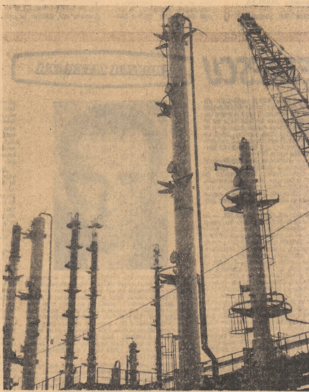
Combinatul chimic Pitești