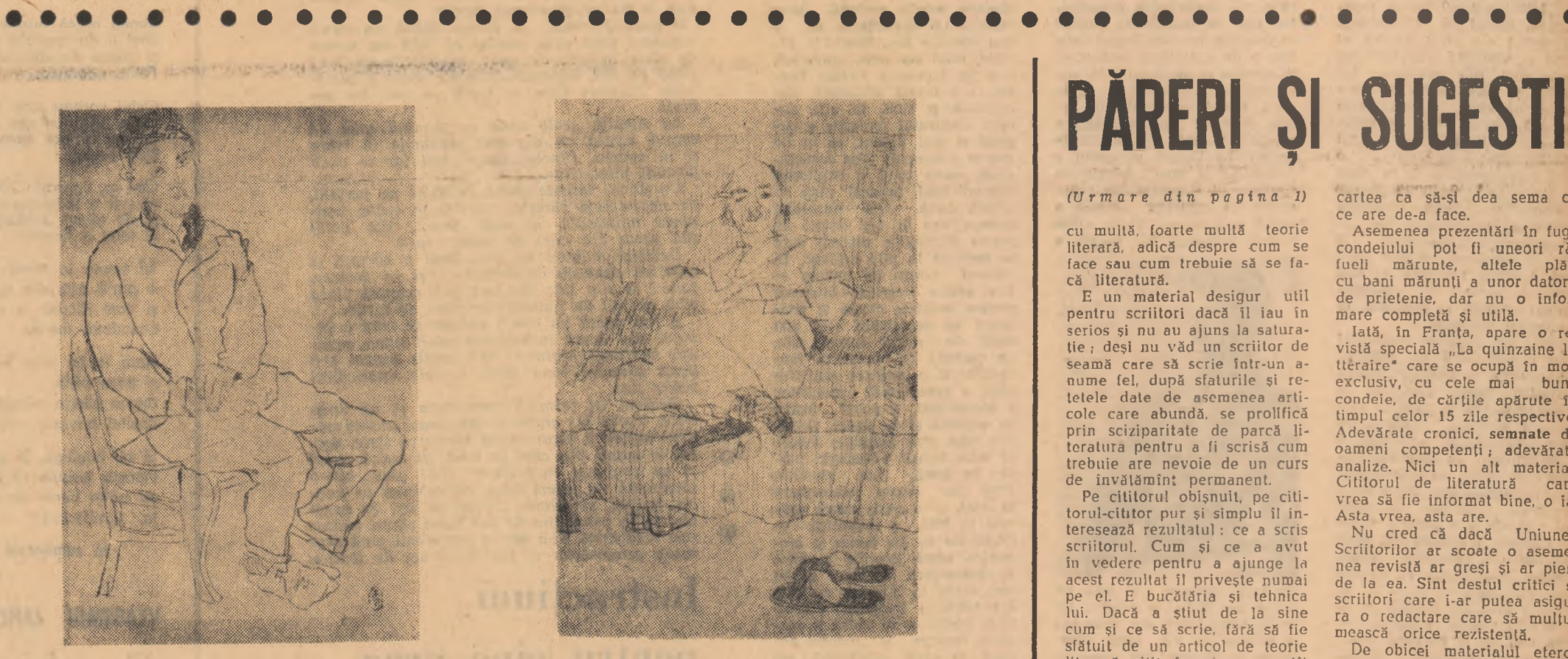
Desene de George Tudor