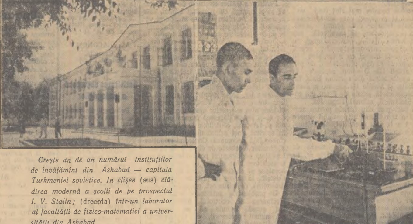
Crește an de an numărul instituțiilor de învățămînt din Ashgabat — capitala Turkmenei sovietice. În clișee (sus) clădirea modernă a școlii de prospectul I. V. Stalin; (dreapta) într-un laborator al facultății de fizico-matematică a universității din Ashgabat.