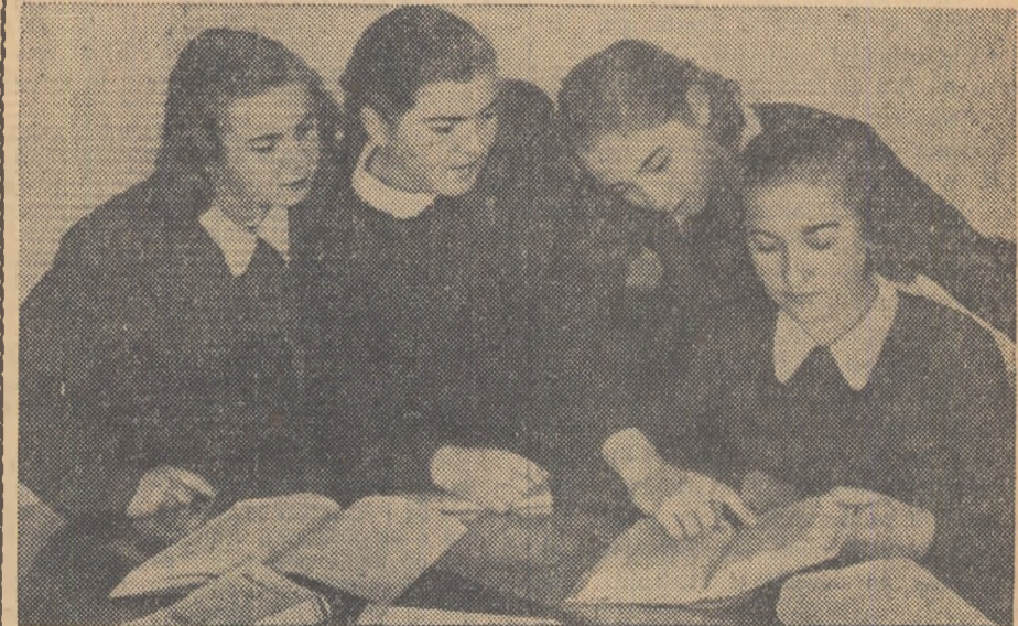
Elevele studiază cu drag operele scriitorilor noștri

tru ca în schimbul avantajelor de care se bucură să livreze animale, păsări și produse animale în cantități cît mai mari și de bună calitate. Să arătăm în mod concret țărănilor muncitori cu gospodărie individuală, colectivă, țărănilor întovărășiți sau asociați că, lupînd pentru creșterea de animale și valorificînd produsele animale pe calea contractărilor, își vor crea un puternic izvor de venituri pentru familiile lor. În același timp, ei vor contribui la îndeplinirea nevoilor muncitorilor de la orașe, care, sporindu-și eforturile, trimit la rîndul lor la sate, tot mai multe unelte agricole și mărfuri industriale de tot felul.