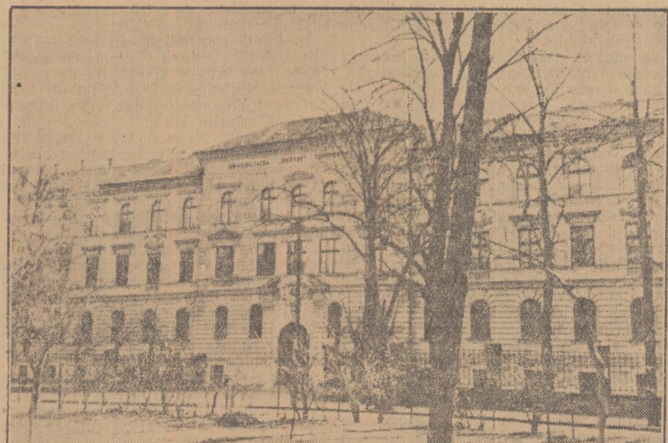
Cele mai bune condiții sînt create în patria noastră pentru învățătura fiilor oamenilor muncii din rîndurile minorității naționale. În clișeu: una din clădirile spațioase ale Universității „Bolyai” din Cluj.

Încurajat și stimulată de rezultatele obținute, colectivul pedagogic al școlii noastre s-a hotărît încă de la începutul acestui an școlar să extindă această muncă, pentru a da comunei noastre buni agricultori. Astfel, pentru ca elevii să cunoască bine