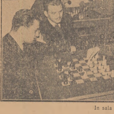
În sala de șah

La clubul central se vor desfășura campionatul și simultane de șah, competiții de tenis de masă etc. Pentru ac-