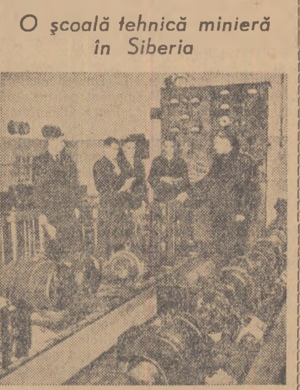
Studentii ai școlii tehnice miniere din Prokopiievsk la lucrările practice din cabinetul de mașini electrice.

La zece kilometri de orașul siberian Prokopiievsk se ridică corpurile școlii tehnice miniere — una dintre cele mai mari instituții de învățămînt care pregătește cadre tehnice medii pentru industria carboniferă a Siberiei. În centrul orașului școlii se află corpul principal — o frumoasă clădire cu cinci etaje, împodobită cu coloane. În jurul ei sînt clădiri de locuit cu multe etaje, în care trăiesc profesorii și elevii. Orașelul școlar are un club, o sală de spectacole cu 500 de locuri, o cantină, grădiniță de copii, creșă etc. Cursurile școlii tehnice miniere sînt urmate de 2200 de elevi. Cabinele și laboratoarele sînt utilate cu cele mai noi și mai perfecționate mașini — u-nelte, aparate și instrumente. În atelierul mecanic al școlii sînt instalate peste treizeci de mașini-unelte de tăiat metale.