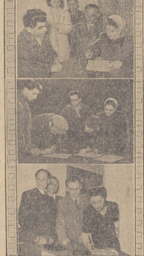
În școlile din întreaga țară se aștern noi semnături pe Apelul păcii.

Numeroase cadre didactice din Capitală au participat la „Jurnalul vorbit” închinat luptei pentru pace, care a avut loc zilele acestea la Clubul sindical al muncitorilor din învățămînt.