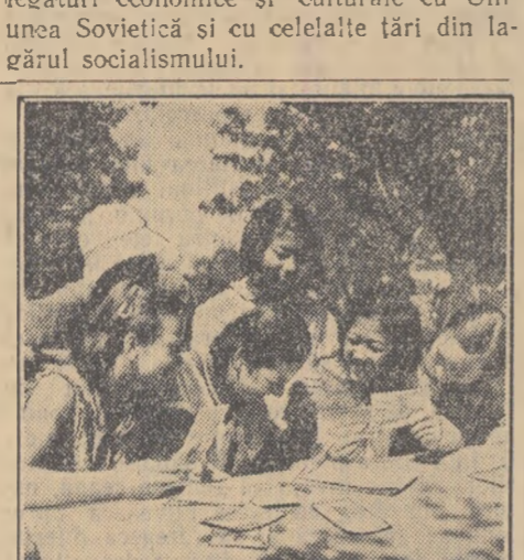
Copii coreeni în mijlocul pionierilor români, în tabăra de la Mamaia

Asăzi, după terminarea războiului, oamenii de știință ai Republicii își pun toate cunoștințele și toate aptitudinile lor în slujba operii de reconstrucție și dezvoltare democratică în partea de nord a Republicii, a unificării pasnice a patriei. Munca științifică desfășurată în perioada de după război interesează realizările obținute în timpul războiului. În fata acestei munci se deschid perspective minunate, care permit înflorirea rapidă a științei coreene datorită griii neprecupețite a partidului și guvernului și puternicelor legături economice și culturale cu Uniunea Sovietică și cu celelalte țări din lagărul socialismului.