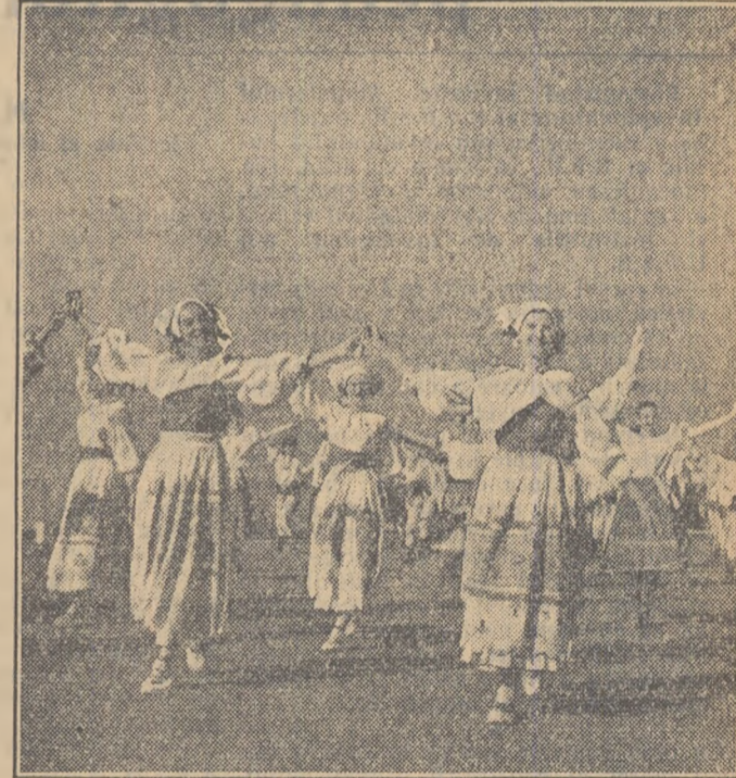
În fotocronica noastră: tinere poloneze delegate la festival (sus stînga); un minunat dans național prezentat la festival (sus dreapta); marelui Palat al Culturii din Varșovia, luminat de reflectoare (jos, stînga); tradiționalul schimb de insigne (jos, dreapta).