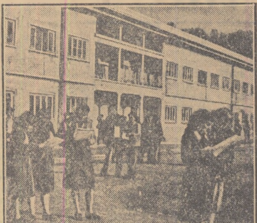
Studenți ai Institutului Tehnic „17 Noiembrie” din Tirana

Pășind în cel de al 12-lea an al vietei sale libere, poporul albanez, strîns unit sub steagul birurilor al Partidului Muncii, mergînd alături de toate popoarele iubitoare de pace din lume, este hotărît să continue cu aceeași însușire munca și lupta pentru o patrie înfloritoare, pentru pace, prietenie și colaborare frățească între popoare.