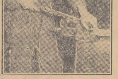
Elevii pilesc fețele dornului.