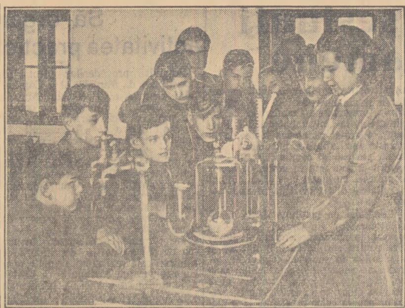
În cabinetul de fizică al școlii medii nr. 3, cu limba de predare maghiară din Satu Mare.