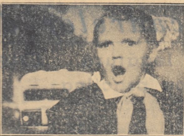
Scenă din filmul „Voi ține minte”.

În întinerul sălii, micii spectatori urmăresc cu răsunătoare atenție și răsunătoare simțire „Voi ține minte”