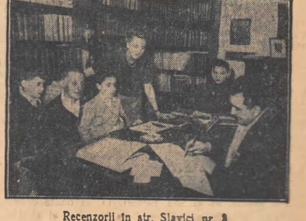
Recenzorii în str. Slavici nr. 9