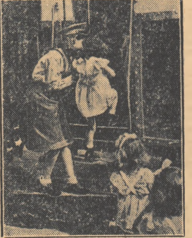
Cea mai tînără călătore urcă în trenul pionierilor.