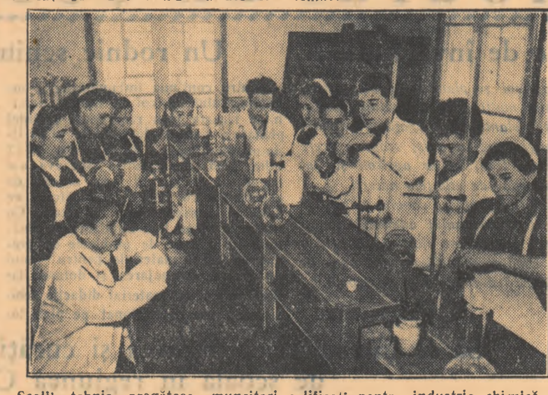
Școlile tehnice pregătesc muncitori calificați pentru industria chimică.

menii ale economiei noastre naționale. Tinerii ucenici și elevi au avut posibilitatea de a alege printre nenumerate meserii de mare valoare pentru industria socialistă, agricultura mecanizată și sectorul social-cultural. Desigur, cei mai mulți se îndreaptă spre sectoarele cheie ale economiei imbrățișând meserii din metalurgia grea și prelucrătoare - de la meseria de furnalist sau de otelar pînă la aceea de strungar sau ajustor de precizie. Mii de elevi se îndreaptă de asemenea spre meseriile din agricul-tură, sectorul electrotehnic, indus-triea minieră și a petrolului, industria construcțiilor, transporturilor, industria bunurilor de consum.