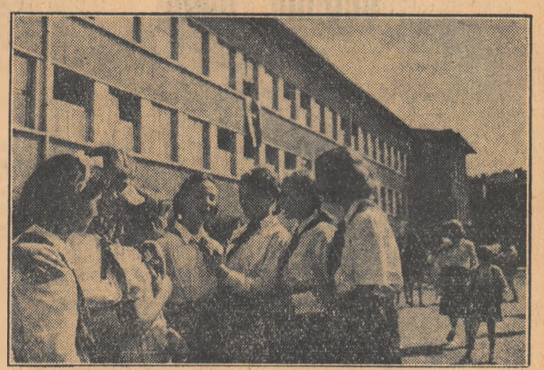
Într-o școală medie de fete din Sofia

șe au fost deschise pe lângă Academie 35 de institute de cercetări științifice, în care lucrează 90 de academicieni și membri corespondenți ai Academiei, 300 de colaboratori științifici și sute de ajutoare administrative și tehnice. Academia de Științe din Bulgaria a fost fundamental reorganizată, în fața ei punându-se sarcini importante științifice și social-politice. Ei i-a fost incredințată toată munca științifică cu privire la problemele de bază ale tuturor ramurilor științei. I-a fost incredințată conducerea întregii activități a tuturor instituțiilor științifice, studierii bogățiilor naturale ale țării, sarcina de a contribui la dezvoltarea și ridicarea forțelor ei productive.