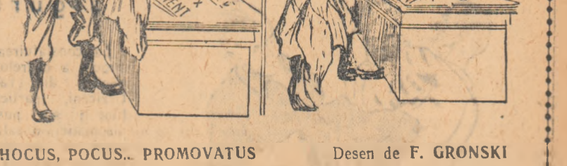
HOCUS, POCUS... PROMOVATUS

În timpul cercetărilor, fiind întrebat ce are de spus asupra celor nusi în lumina de anchetă, Dumitru Voicila a fost de părere că aceștia sînt „lînșuri mîrcute” și a cerut... să fie trimis la cursurile de perfec-