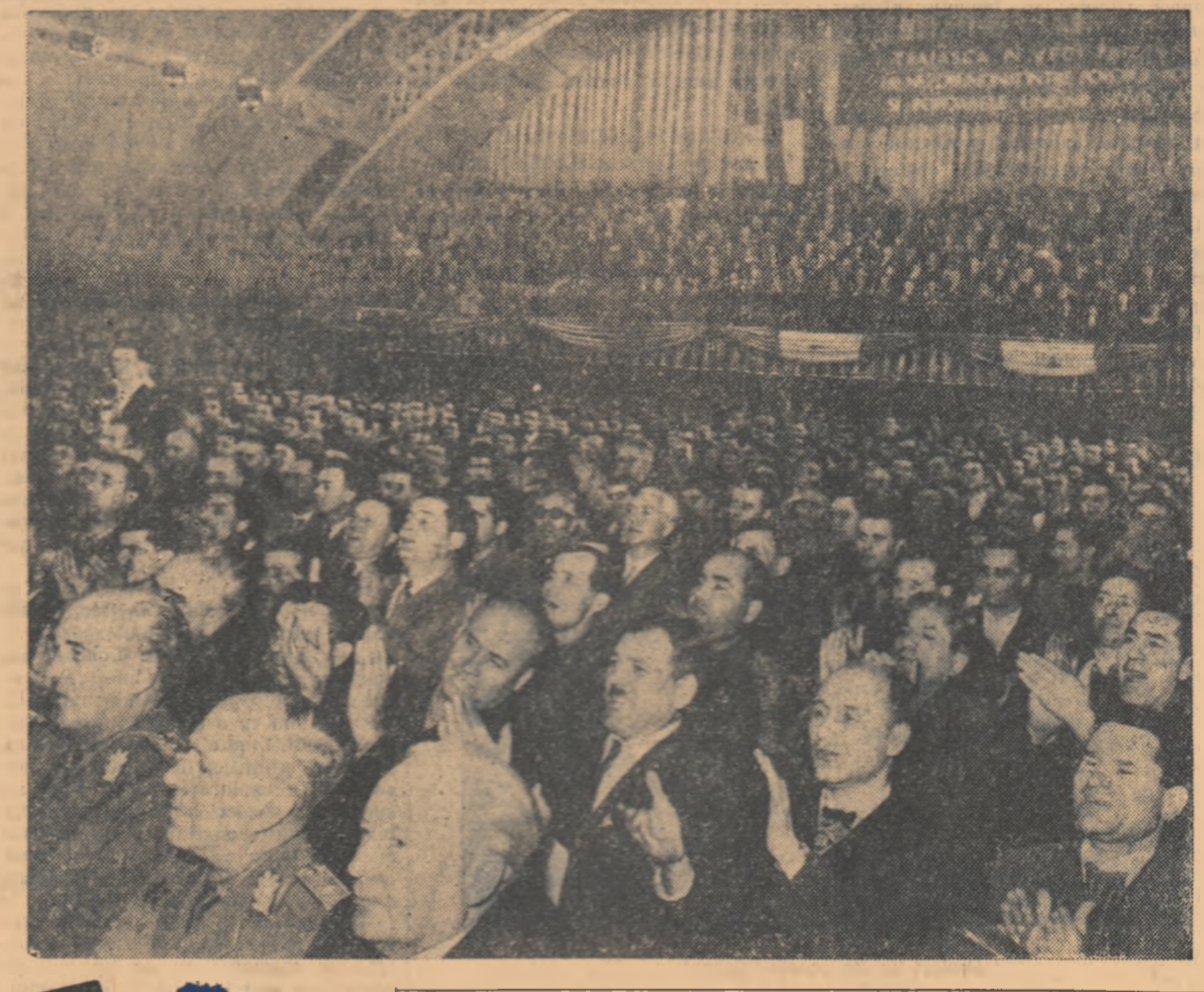
de la adunarea festivă din sala Floreasca.

În ziua de 8 noiembrie a.c. tovarășul Gh. Gheorghiu-Dej, prim secretar al Comitetului Central al Partidului Muncitoresc Român, a împlinit 55 de ani. Delegația tineretului din R.P.R., în frunte cu tov. Virgil Trofin, prim secretar al C.C. al U.T.M., a transmis tovarășului Gh. Gheorghiu-Dej salutul Consiliului Central al Uniunii Tineretului Muncitor. Tovarășul Gh. Gheorghiu-Dej a mulțumit celor prezenți și prin el tuturor oamenilor muncii pe care îi prezintă pentru felicitările și caldele cuvinte ce i-au fost adresate, asigurîndu-și că va lupta și pe viitor cu aceeași hotărîre ca pînă acum pentru interesele clasei muncitoare și ale poporului român, pentru cauza socialismului și a păcii.