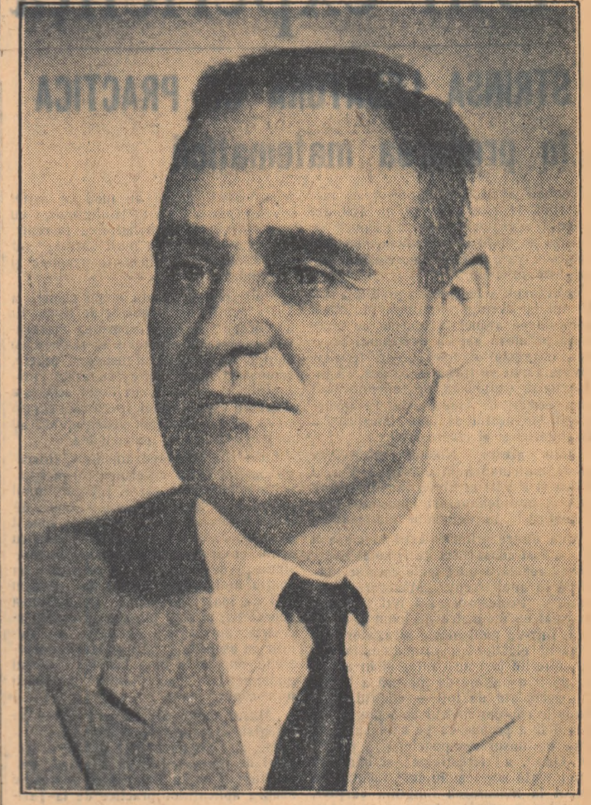
Tovarășului GH. GHEORGHIU-DEJ prim secretar al Comitetului Central al Partidului Muncitoresc Român

La a 55-a aniversare a zilei tale de naștere, Comitetul Central al Partidului Muncitoresc Român, Preziidul Marii Adunări Naționale și Consiliul de Miniștri al Republicii Populare Romine îți urează, scumpe tovarășe Gheorghiu-Dej, multă sănătate și putere de muncă pentru a putea îndeplini, ca și pînă acum, marile sarcini pe care partidul îți le-a încredințat.