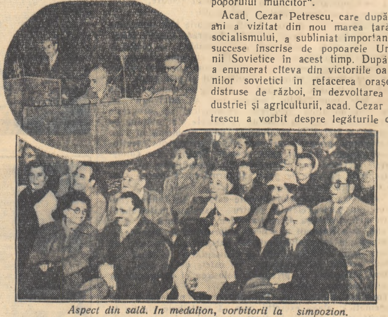
Aspecte din sală. În medașion, vorbitorii la simpozion.