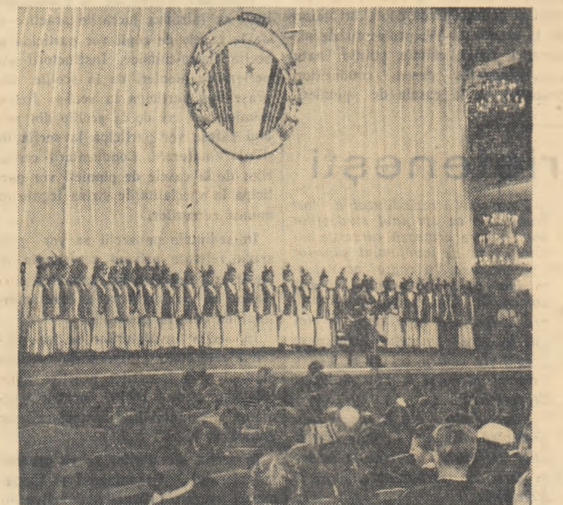
La finala concursului anual al artiștilor amatori din Uniunea Sovietică, a participat și corul unui institut pedagogic, care s-a bucurat de un frumos succes.

Peste tot am constatat un mare interes pentru țara noastră, pentru realizările poporului nostru. La ministerele noastre.