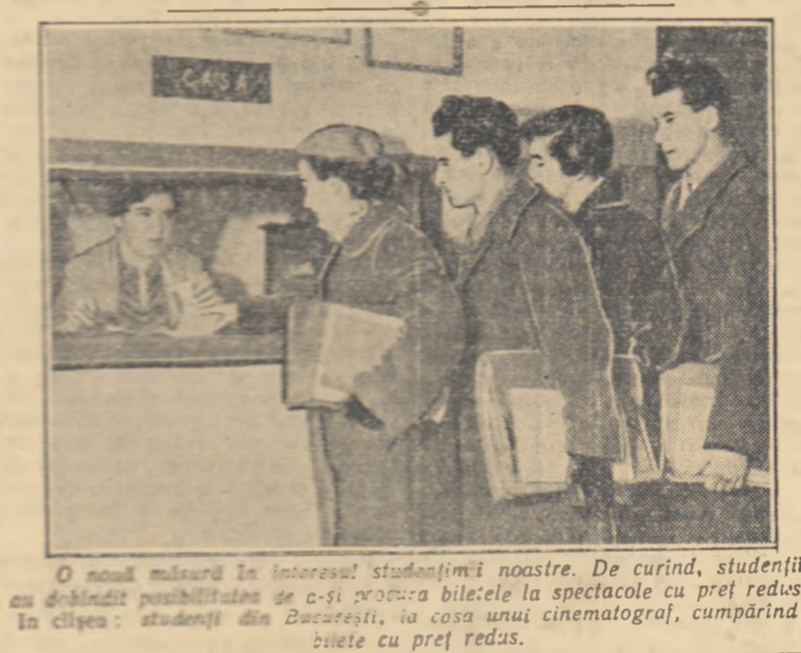
O nouă măsură în interesul studenților noastre. De curînd, studenții au dobîndit posibilitatea de a-și procura biletele la spectacole cu preț redus. În clipa: studenții din București, la casa unui cinematograf, cumpărînd bilete cu preț redus.