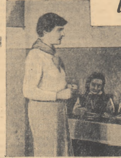
O discuție oarecum neplăcută des pre finiu...

CC. al S.M.I. și „Gazeta învățămîntului” vor alcătui comisia centrală, care va fi compusă din 11 membri. În cursul lunii august 1957 se va organiza expoziția raională privitoare