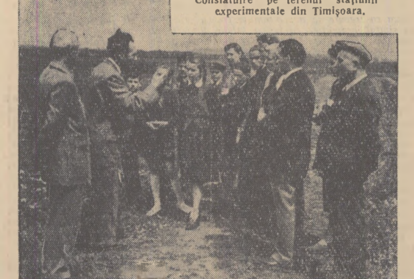
Consfătuire pe terenul stațiunii experimentale din Timișoara.

a stațiunii a fost îndeplinit anul acesta la timp și in condiții bune. Lucrările au fost executate pe o parcelă rezervată cerealelor de toamnă, pe o suprafață de aproximativ 540 mp. Aici au fost semănate, pe straturi de cîte 3 mp, in cultură comparativă, diferite soiuri de cereale de toamnă, urmîndu-se la fiecare in parte demonstrarea importanței aplicării unor