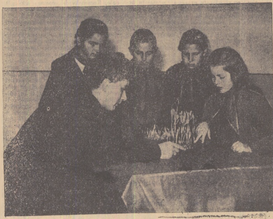
La căminul de copii al Combinatului chimic „I. V. Stalin” din orașul Victoria.