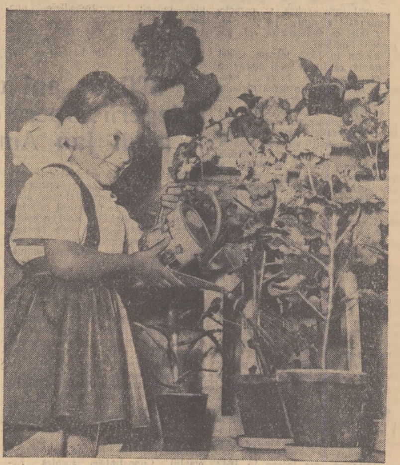
La căminul de copii al Combinatului chimic „I. V. Stalin” din orașul Victoria.