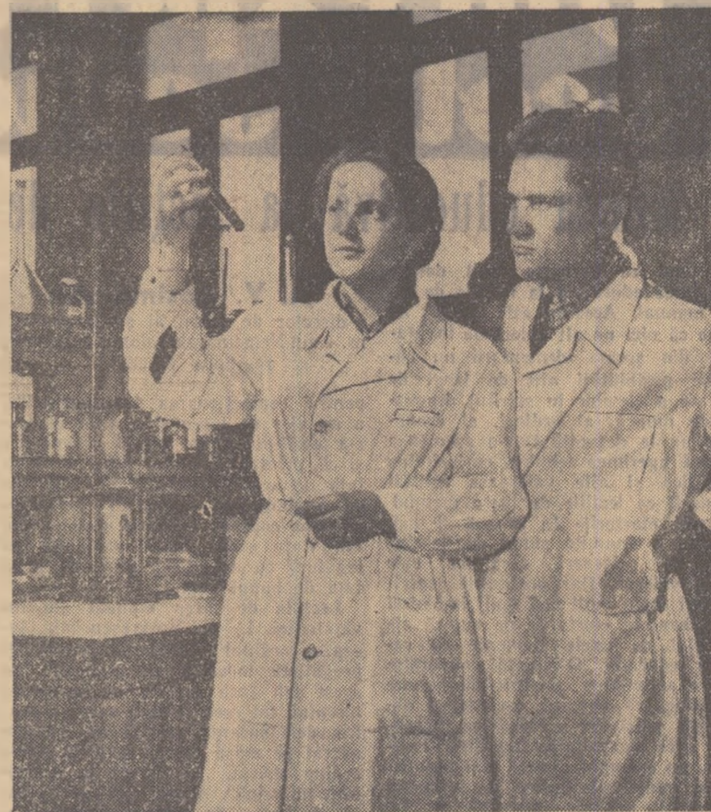
Studentii Institutului de mine „Gh. Gheorghiu-Dej” din Petroșani desfășoară o intensă activitate în laboratorul Institutului.

La Institutul de mine „Gh. Gheorghiu-Dej” din Petroșani