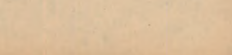
Elevii ai școlii de 7 ani nr. 15 din Ploiești lucrînd la rîndușnița de pe tolatul experimentat.