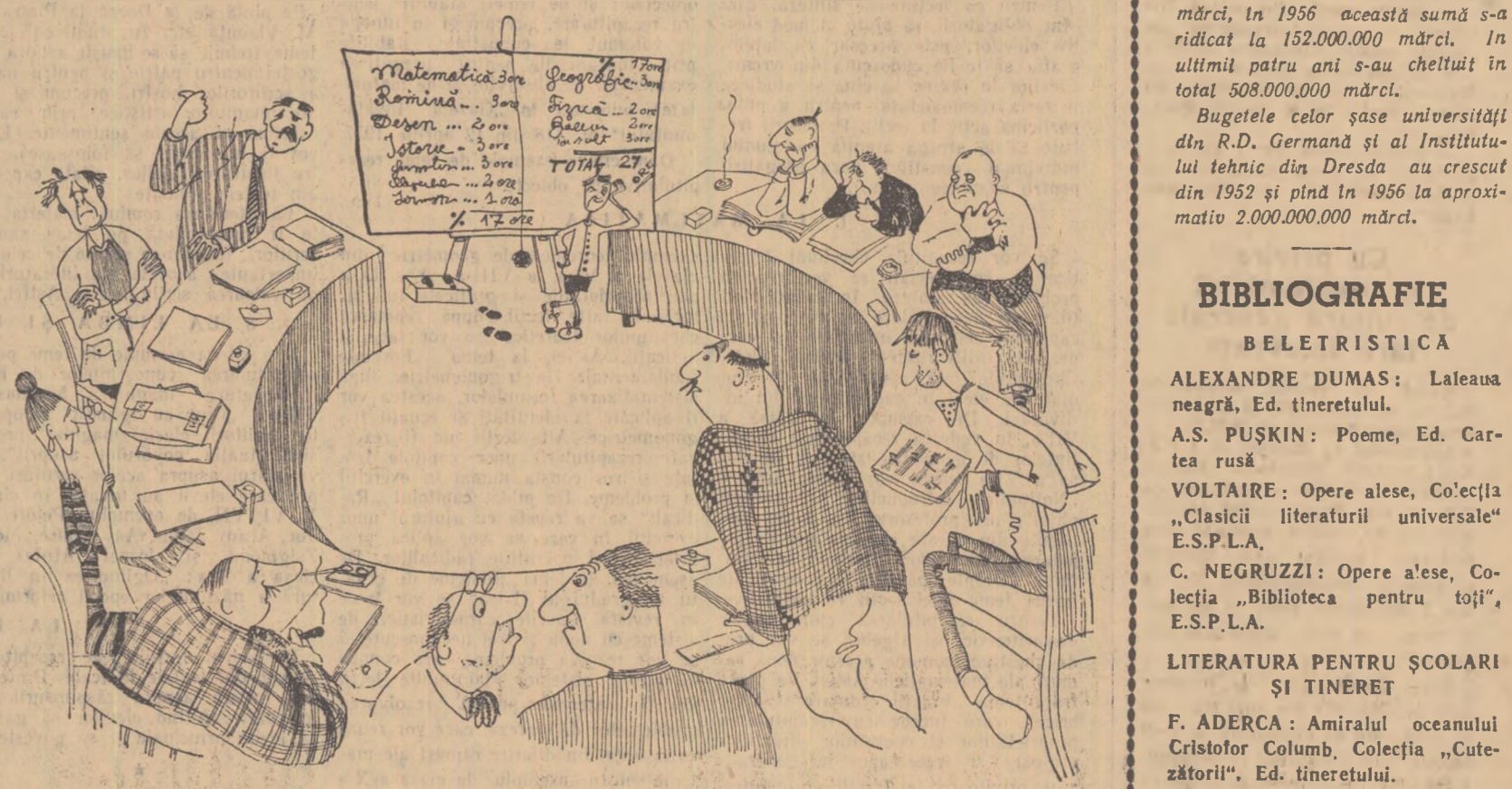
Suprîncercarea elevilor văzută de CORNELIU DAN