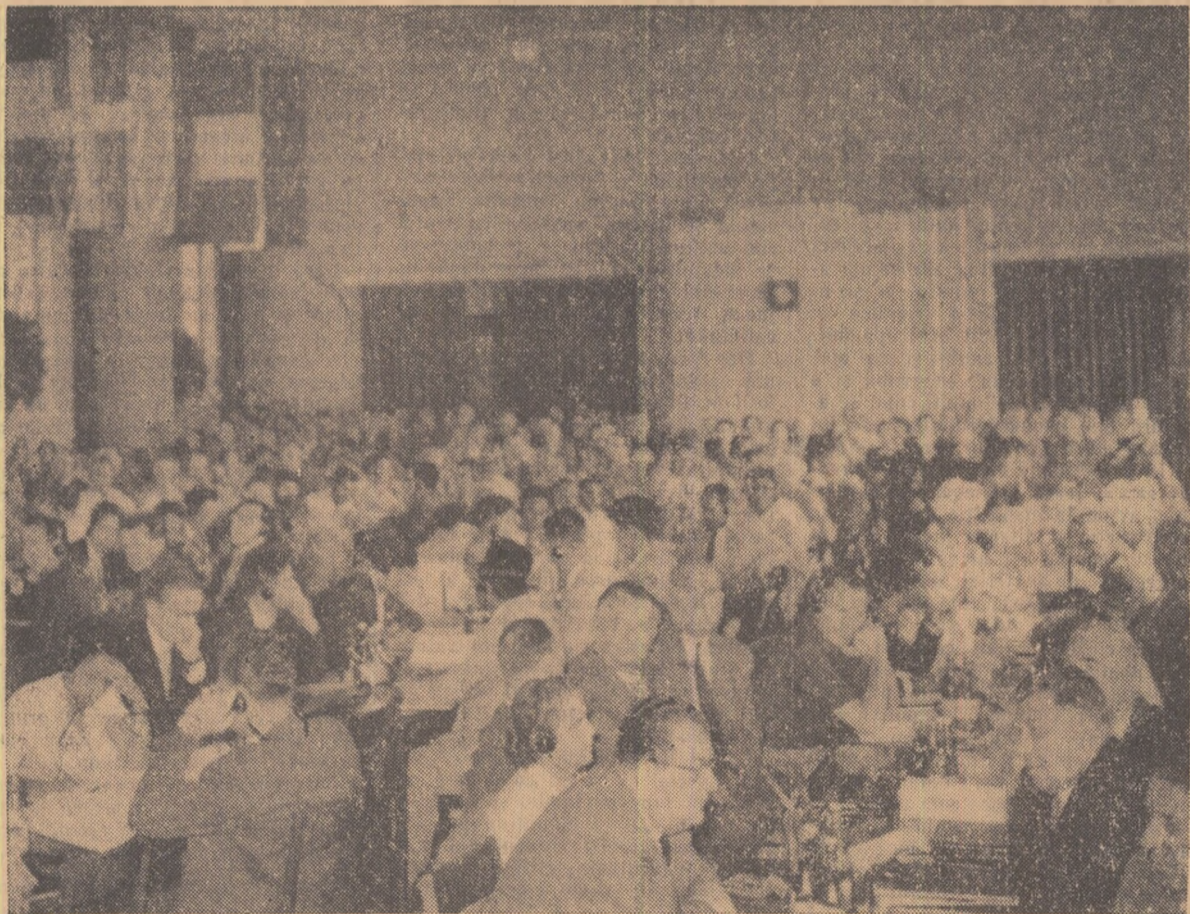
Aspecte de la Conferința mondială a educatorilor, de la Varșovia

Pe baza acestor informații se va desfășura o acțiune susținută pentru obținerea unor condiții mai bune de muncă.