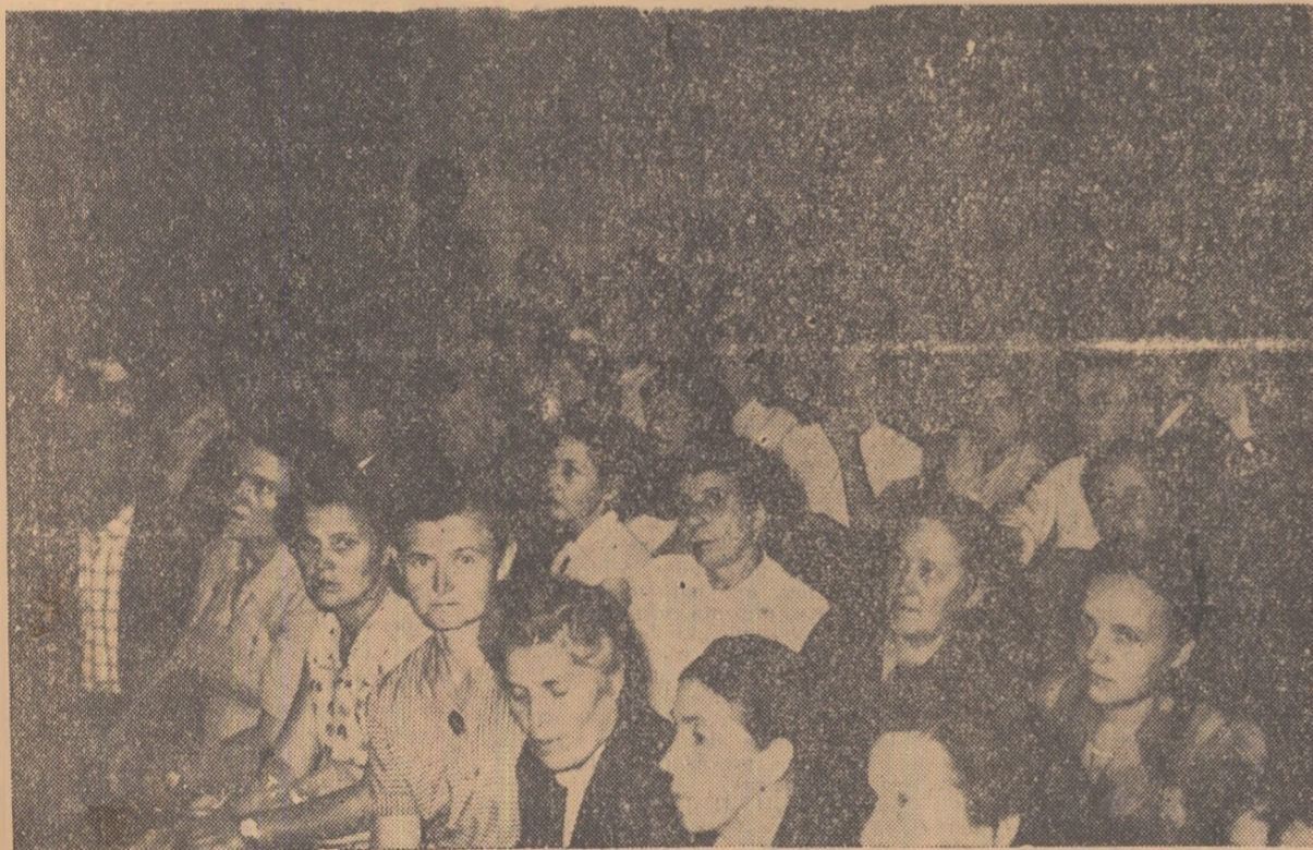
În timpul consfăturii de la Tecuci.