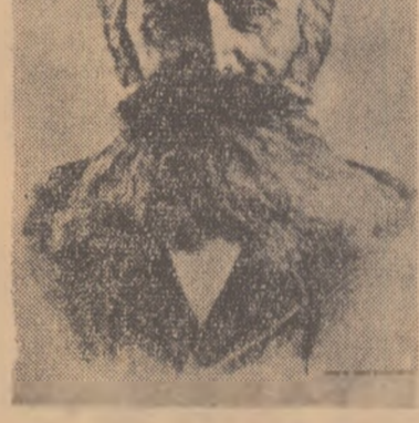
Desen de ADINA PAULA MOSCU

Lucrările științifice publicate de Hasdeu nu sint simple registre de eruditie; în fiecare pagină palpăm