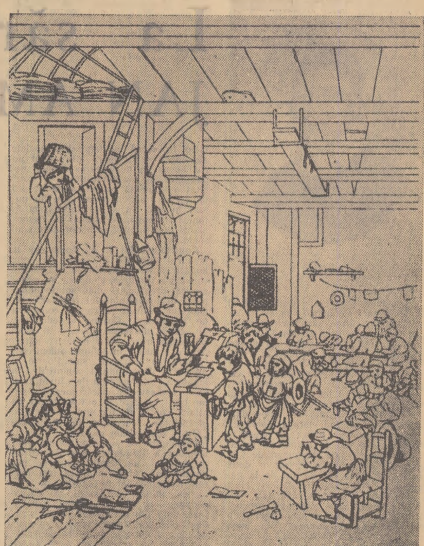
Școala sătească în timpul lui Komensky