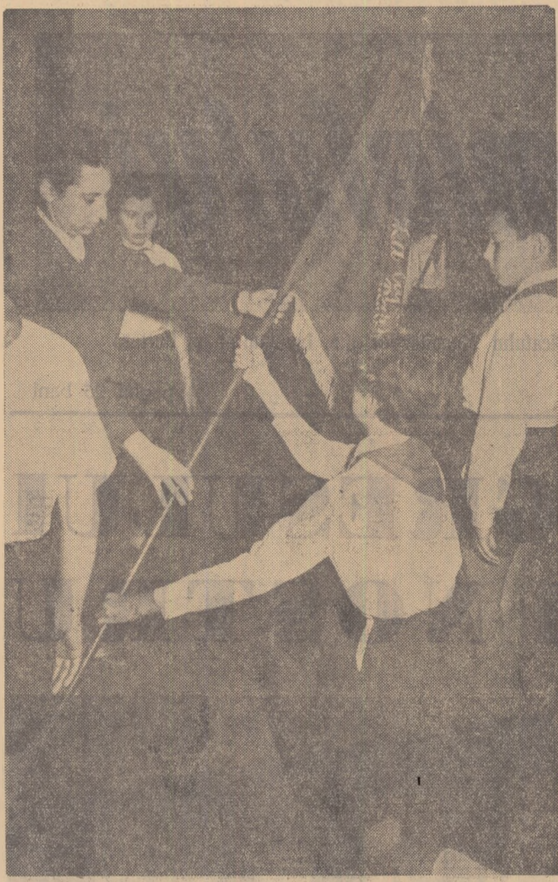
Președinta unității de pionieri nr. 18 primește noul drapel roșu al unității pe care este înscris numele tovarășului Grigore Preoteasa, neînfricat luptător pentru fericirea poporului.

La sfîrșit, directorul școlii a dat citire unei telegramă către C.C. al P.M.R. și Consiliul de Miniștri prin care profesorii, elevii și cetățenii din cartier mulțumesc cu căldură pentru onoarea acordată școlii lor.