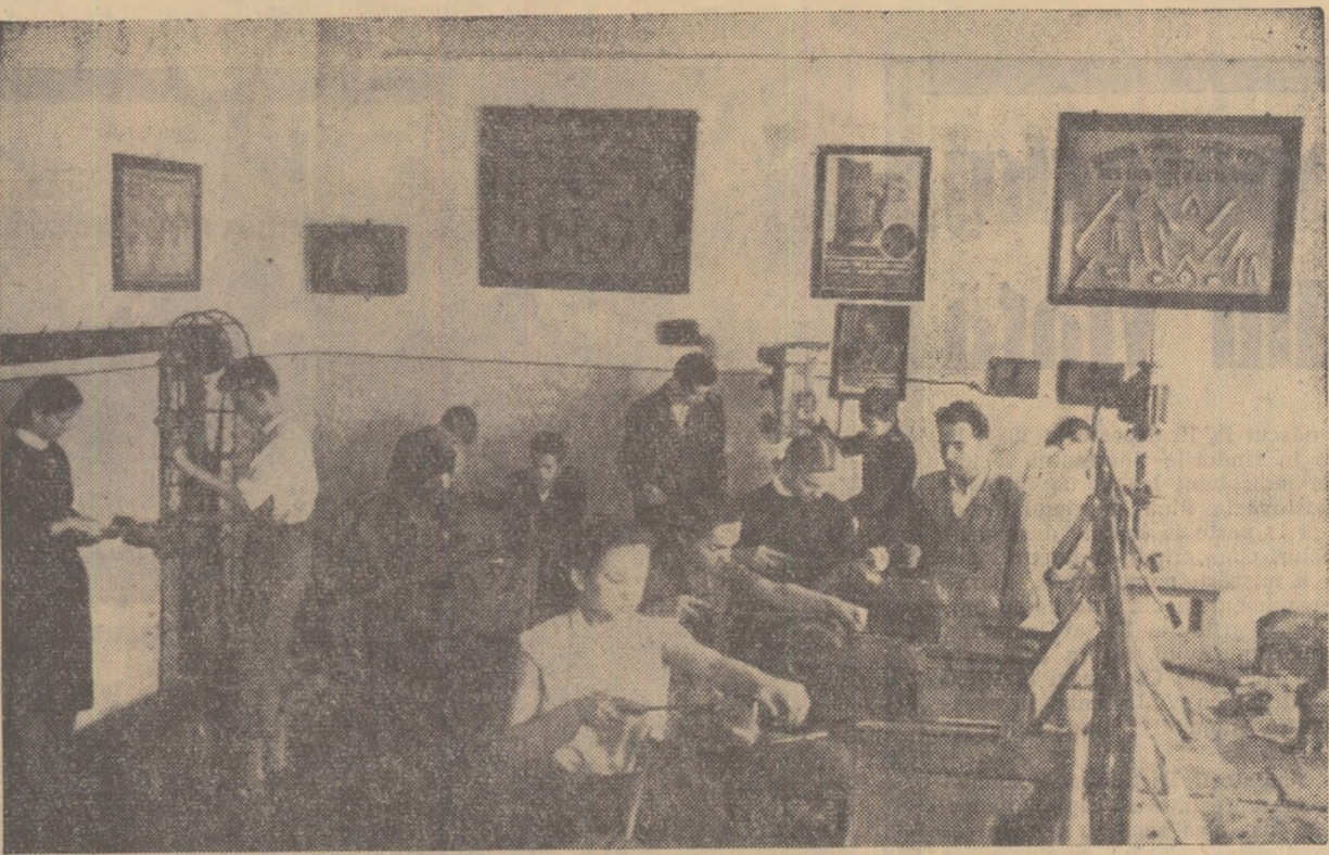
Eleveii clasei a VIII-a de la școala medie mixtă din Cîmpia Turzii, în atelierul de lăcătușerie.