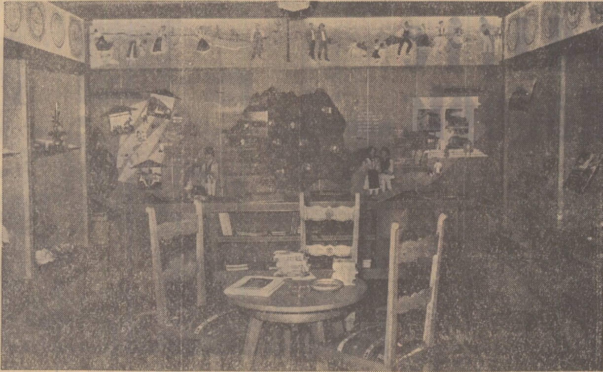
Un colț al standului românesc de la expoziția organizată cu prilejul celei de-a 20-a sesiuni a Conferinței internaționale pentru instrucțiune publică